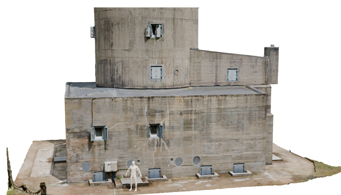
Rys. 3 Model przyziemia Wieży opracowany w Agisoft Metashape

W wyniku przeprowadzonych prac opracowano trójwymiarowy model wieży, z zachowaniem struktury materiałów i detali architektonicznych. Model może stanowić podstawę do dalszych działań związanych z popularyzacją historii obrony wybrzeża, w tym tworzenia wizualizacji edukacyjnych, materiałów muzealnych lub interaktywnych prezentacji. Do dalszej ścieżki rozwoju projektu należy przygotowanie fizycznego modelu przy pomocy technologii druku 3D po odpowiednim przygotowaniu uzyskanego modelu, a także utworzenie interaktywnego modelu opartego na silniku Unreal Engine 5.