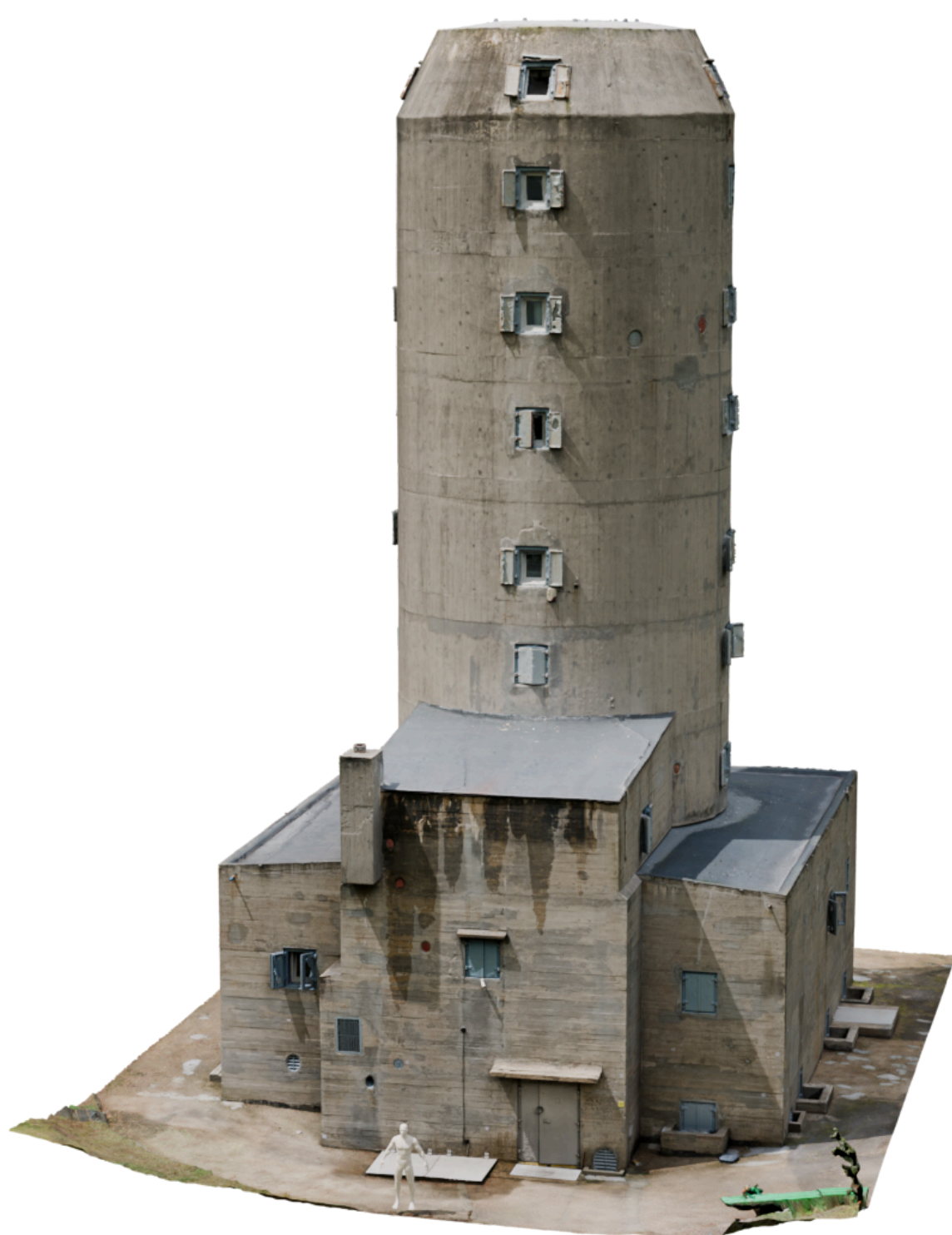
Rys. 2 Wyrenderowany model Wieży Kierowania Ogniem

Dzięki współpracy studentów KN Hevelius oraz SKN Geodetów Uniwersytetu Przyrodniczego we Wrocławiu, z zastosowaniem techniki kinematycznej GNSS założono osnowę pomiarową, a w miejscach charakterystycznych wieży umieszczono fotopunkty. Ich położenie pomierzono tachimetrycznie w nawiązaniu do wcześniej założonej osnowy, w ten sposób uzyskano współrzędne fotopunktów w państwowym układzie odniesienia PL-2000. Po zakończeniu pomiarów położenia fotopunktów, przystąpiono do wykonywania dokumentacji fotograficznej. Zdjęcia górnej części wieży wykonano przy pomocy bezzałogowego statku powietrznego, natomiast dokumentację niższych fragmentów budynku uzupełniono fotografiami naziemnymi. Zebrany materiał opracowano w programie Agisoft Metashape. Opracowanie polegało na połączeniu zdjęć, geolokalizacji w oparciu o pomierzone fotopunkty i wygenerowanie modelu w postaci siatki mesh wraz z teksturą. Uzyskana tekstura umożliwiła na wierne odwzorowanie powierzchni żelbetowych ścian zewnętrznych wieży.