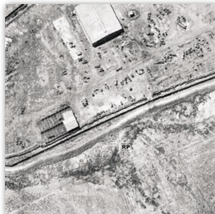
Rys. 4. Fragmenty zdjęć uzyskanych z UAV ( Unmanned Aerial Vehicle )

wykrycia zmian w zabudowie i zagospodarowaniu obszarów zainteresowania.