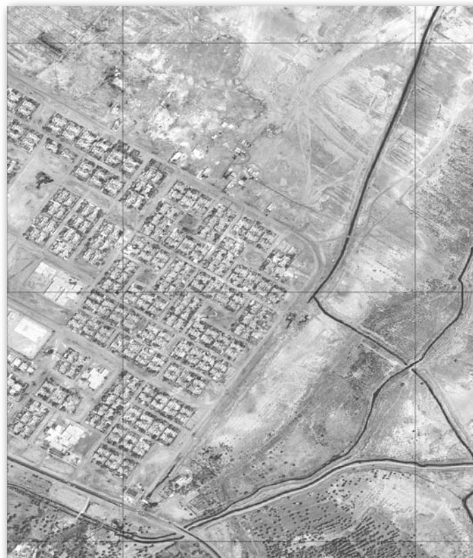
Rys. 3. Zdjęcie satelitarne z pikselem „półmetrym” opracowane w skali 1:1000

W praktyce w zastosowaniach wojskowych dla zobrazowań „metrych” wyznaczyliśmy granicę 1:3500, a dla zdjęć „półmetrych” – nawet 1:1000! Wartość graniczna, którą w zasadzie określili odbiorcy naszych produktów, wahała się pomiędzy 2 a 3 piksele na mm. Efekt był jeszcze lepszy, gdy produktem wynikowym była ortofotomapa satelitarna z dodatkowo nałożonymi warstwami wektorowymi. Ciekawe, że im bardziej zbliżaliśmy się do skali 1:10 000, tym bardziej zdjęcie satelitarne wydawało się odbiorcom nieczytelne. Na mapach pewne elementy, jak choćby szerokość drogi, nie są przedsta-