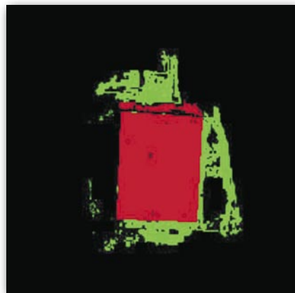
Rys. 5. U góry z lewej zdjęcie stare, z prawej zdjęcie nowe. Poniżej wynik „odjęcia” zdjęć z użyciem narzędzia Change Detection programu ERDAS: po lewej – w skali szarości, po prawej – w kolorach umownych