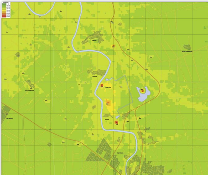
Rys. 7. Nałożenie DTED na plan miasta w skali 1:12 500, w centralnej części widoczne trzy wierzchołki Babilonu tworzące trójkąt równoboczny (wierzchołki w czerwonym kolorze)

Ponadto należy stwierdzić, że pozyskiwanie informacji o wybranym obiekcie przebiega w sposób dosyć przypadkowy. Mają na to wpływ właściwości ośrodka przenoszenia informacji (powietrza) i powierzchni rozpoznawanego obiektu. Zdjęcie lotnicze i obrazy satelitarne zawierają szumy związane z mgiełką atmosferyczną i nierównomiernym oświetleniem fotografowanego terenu. Znaczący jest np. wpływ tłumienia at-