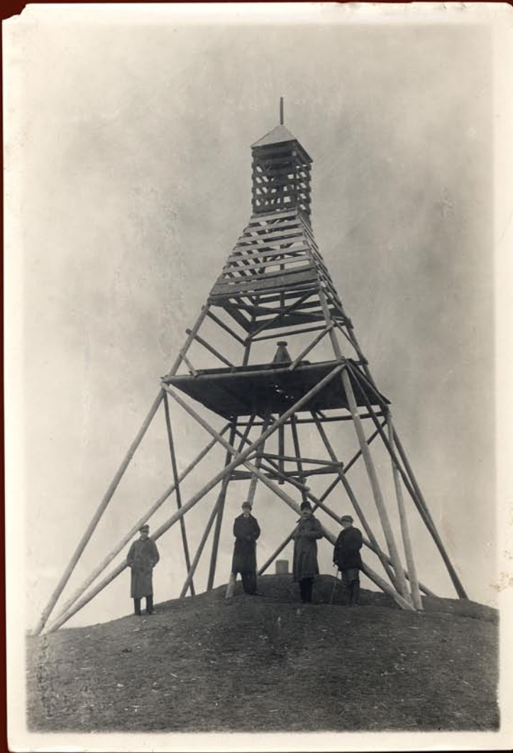
Wieża triangulacyjna „Wysoki Obicz”