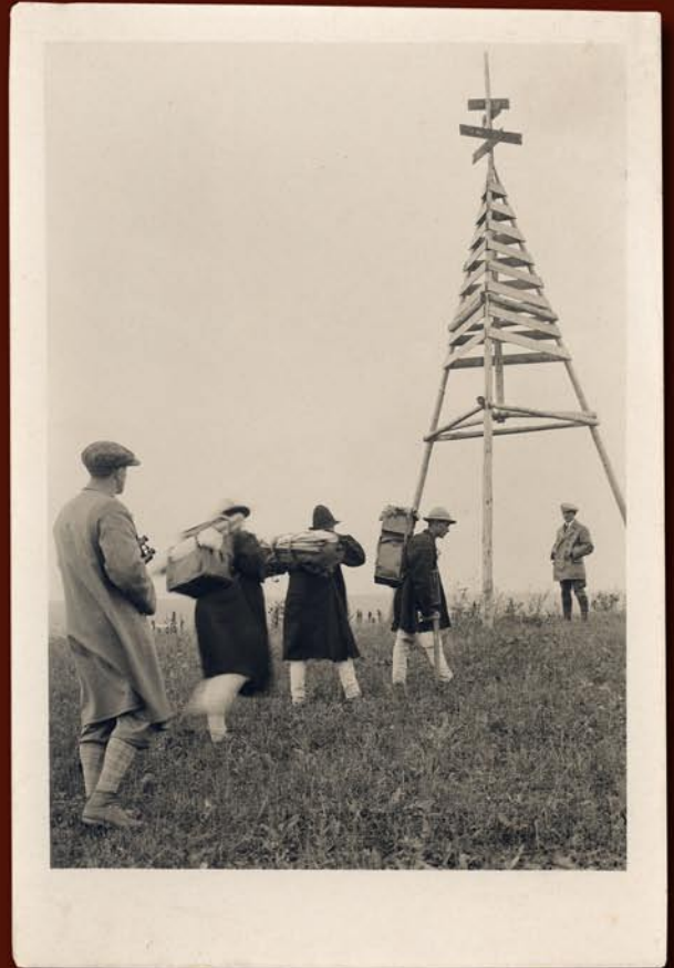
Materiały i sprzęt przenosili Huculi

Korzystano z fototeodolitów i stolików topograficznych. Z tyłu bosa Hucul