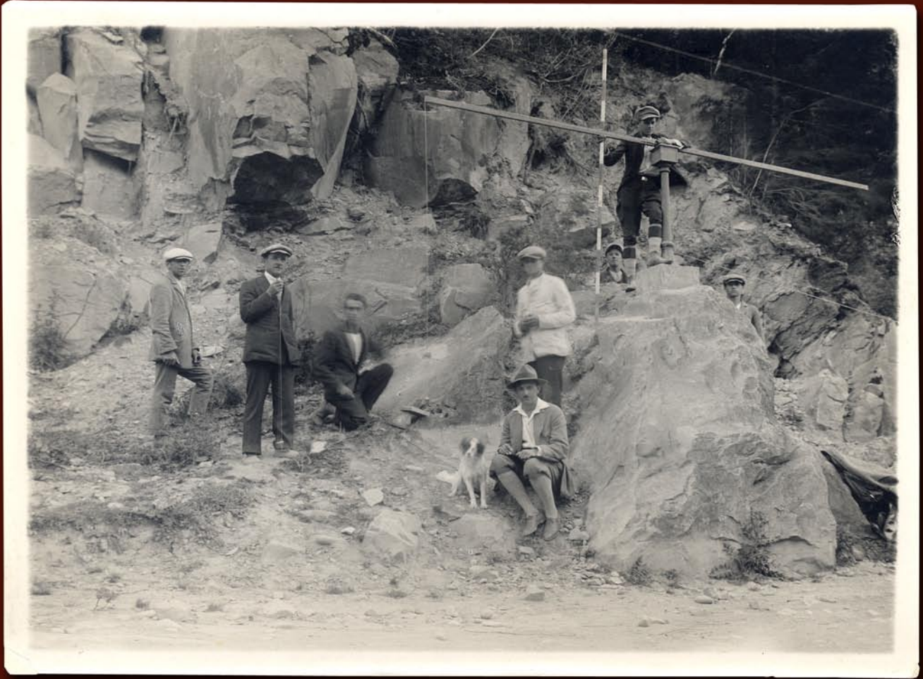
Pomiar długości boku poligonowego na terenie gminy Horocowa