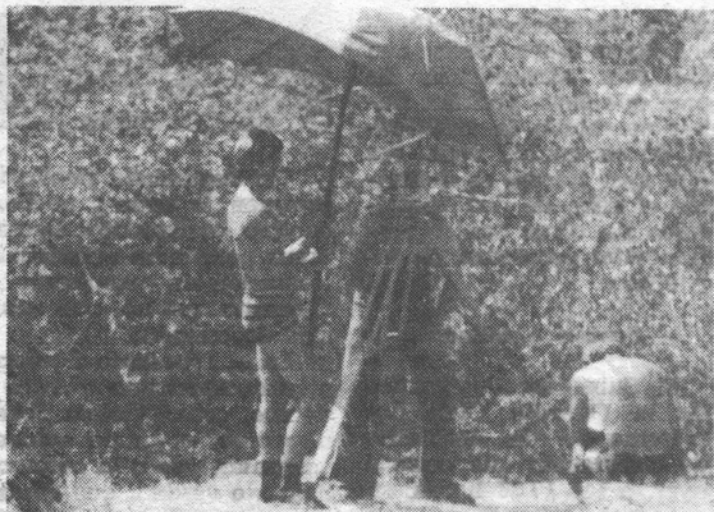
Protegido del sol por la sombrilla que porta un compañero, uno de los técnicos «mide» la estructura de la iglesia de la Veracruz.