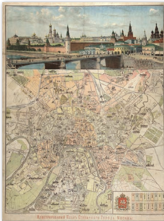
Rys. 3. Ilustrowany plan miasta stołecznego Moskwy (1893 r.) z panoramą Kremla widzianą od strony południowo-wschodniej i widokiem mostu Moskwockiego na pierwszym planie. Wydawca i litografia: Towarzystwo Rozpowszechniania Ksiąg Pożytecznych, chromolitografia kolorowa. Nową granicę miasta tworzy kolej obwodowa spinająca linie kolejowe, łączące miasto z różnymi częściami imperium. Moskwa liczyła wtedy ponad milion mieszkańców i była potężnym ośrodkiem przemysłowo-kupieckim

Poza linią dzisiejszego „pierścienia parkowego”, a ówczesnego wału ziemnego, tereny były słabo zaludnione. Zabudowa skupiła się przy traktach komunikacyjnych i tzw. słobodach poroździelanych łąkami, polami ornymi, stawami i strumieniami. Największe zmiany dotyczyły terenów nad Jauzą na północny wschód od centrum. Oprócz istniejącej wcześniej