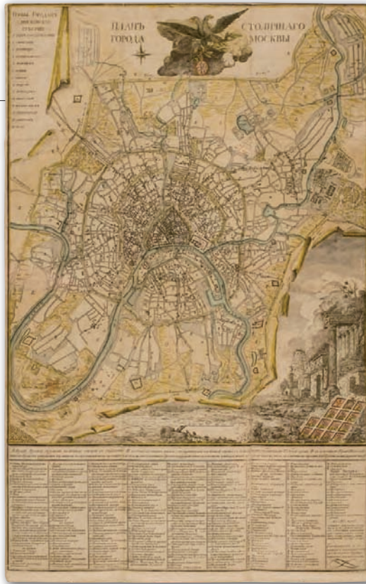
Rys. 2. Plan Kolczugina (1789 r.), którego nazwa pochodzi od nazwiska wydawcy. Autorzy: I. Marczenkov, grav. L. Frołow, miedzioryt kolorowy. Plan o orientacji północnej, oparty na pomiarach, bogato zdobiony w duchu klasycyzmu: podarty kartusz, romantyczne ruiny, winieta tytułowa z orłem dwugłowym. Legendę uzupełniają widoki herbów miast guberni moskiewskiej. Miasto od początku XVIII w. utraciło funkcję stołeczną, zachowując tytuł

Wiek XVIII wraz z objęciem władzy przez Piotra I przyniósł wielkie zmiany polityczne. Nowy władca postanowił zreformować i zmodernizować państwo, dotychczas zamknięte na wpływy zewnętrzne. Na jego rozkaz wysyłano młodzież do szkół zachodnioeuropejskich, by poznała największe osiągnięcia nauki i techniki. Wkrótce powstała Szkoła Inżynierska, w której m.in. uczono miernictwa i sporządzania planów i map.