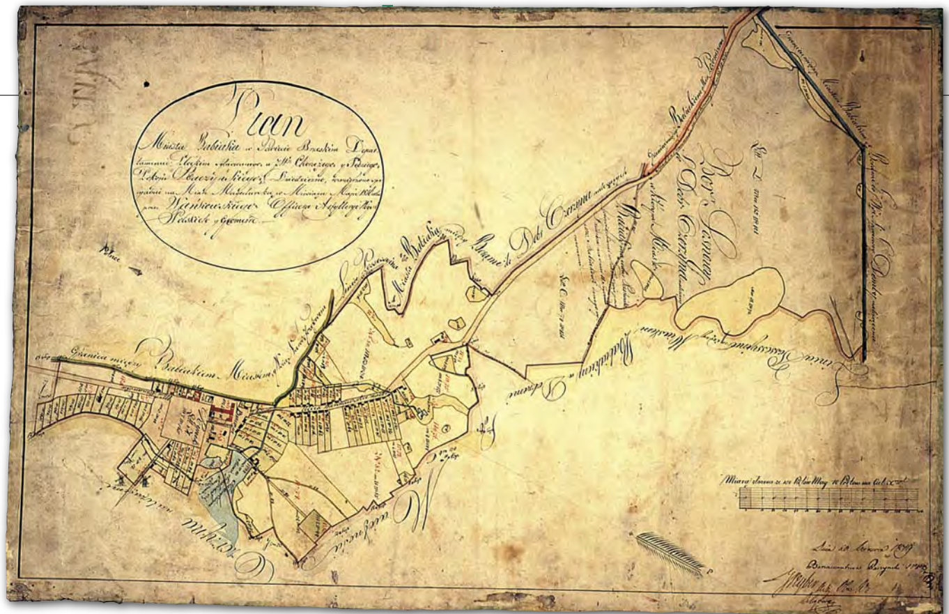
3. Plan miasta Babiaka, 1816 r., Wańkowski, AGAD, Zb. Kart. 46-1

Zalecenia instrukcji z 1823 r. nie zawsze w pełni były realizowane. Często w miejsce dwóch map wykonywano tylko jedną. Instrukcja zalecała też sporządzanie każdej mapy w trzech egzemplarzach, w praktyce powstawał tylko jeden. Mimo trudności w kartowaniu miast, najczęściej natury finansowej, do 1836 r. powstały wielkoskalowe mapy pomiarowe dla około 200 miast Królestwa Polskiego. Wiele z tych map zaginęło, zwłaszcza w okresie II wojny światowej. W 1944 r. w Archiwum Skarbowym w Warszawie spłonął zbiór map miast polskich, którego znaczną część stanowiły kartografika miejskie z lat 1815-1836.