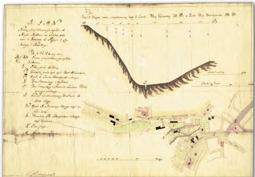
6. Plan nowo projektowanego wjazdu do miasta Lublina na trakcie głównym z Warszawy, 1820 r., Ł. Rodakiewicz, AGAD, KRSW 3660, k. 72, Zb. Kart.