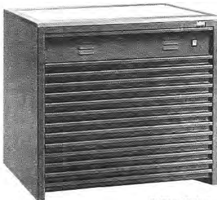
SZSM-B2/13 Szufladowiec z podświetlanym blatem