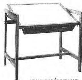
STOŁY PODŚWIETLANE SZTYWNE I UCHYLENE