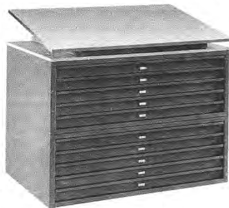
2xSS-B1/5-BU 2 sekcje szuflad z blatem uchylnym