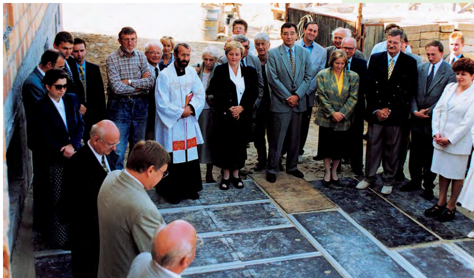
Ceremonia widziana z poziomu dość wysokiego parteru nowego obserwatorium