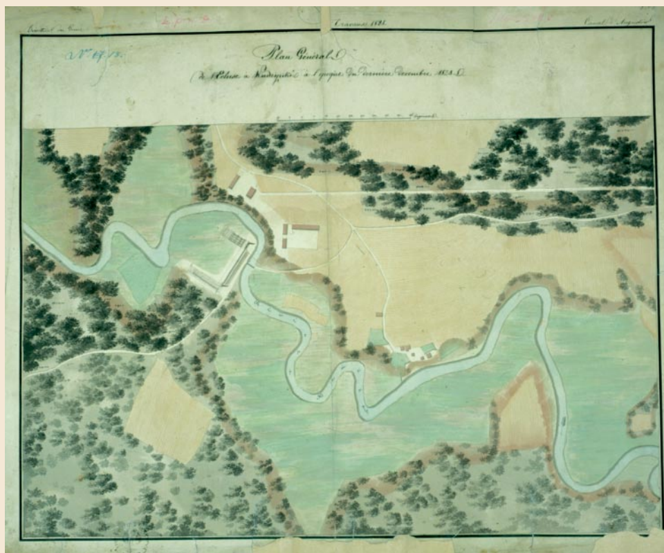
2. Plan sytuacyjny śluzy na rzece Czarnej Hańczy w osadzie Kudrynki, grudzień 1828 r., autor nieznan