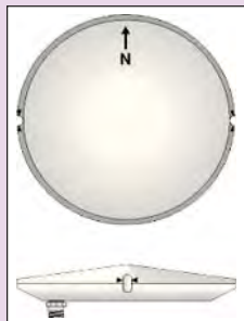
Rys. 9. Wskaźnik na obudowie anteny

Analogicznie liczy się wysokość odniesioną do wspomnianego ARP. Różnica jest jedynie wartością antenna offset . Stałe dodawania potrzebne do wykonania obliczeń powinny być dostarczone przez producenta razem z anteną.