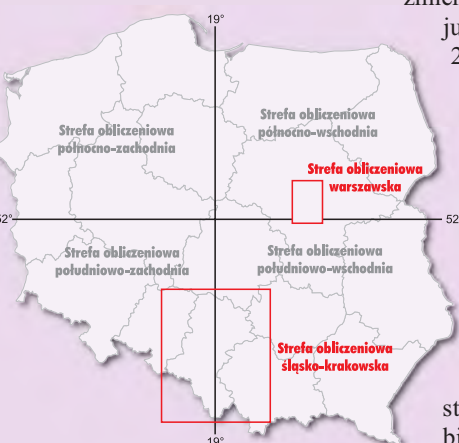
Rys. 7. Strefy obliczeniowe przyjęte w systemie ASG-PL

Jako wzorzec, na podstawie którego rozwijano całą misterną wizję systemu, przyjęto dwuczęstotliwościowy odbiornik geodezyjny wykonujący pomiar w strefie śląsko-krakowskiej z oczekiwaną