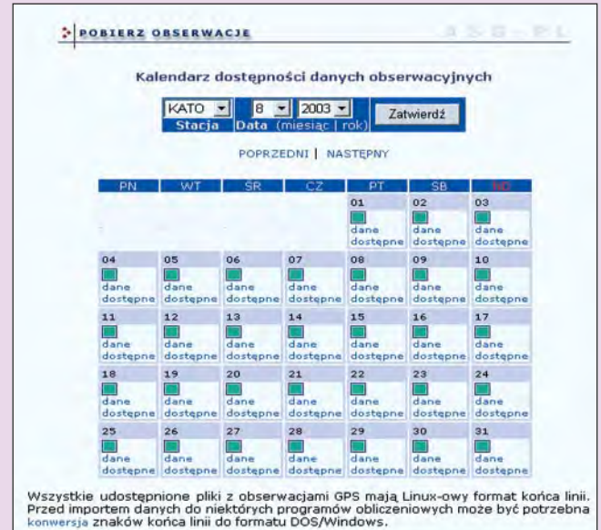
Rys. 2. Kalendarz dostępności danych obserwacyjnych

Podjęcie decyzji o dopuszczeniu ASG-PL do wykorzystania w pracach geodezyjnych będzie możliwe po wykonaniu serii pomiarów testowych GPS obejmujących obszar całego kraju zleconych niedawno przez Główny Urząd Geodezji i Kartografii. Ich podstawowym celem jest określenie warunków niezbędnych do otrzymania wymaganych dokładności dla danej klasy punktów.