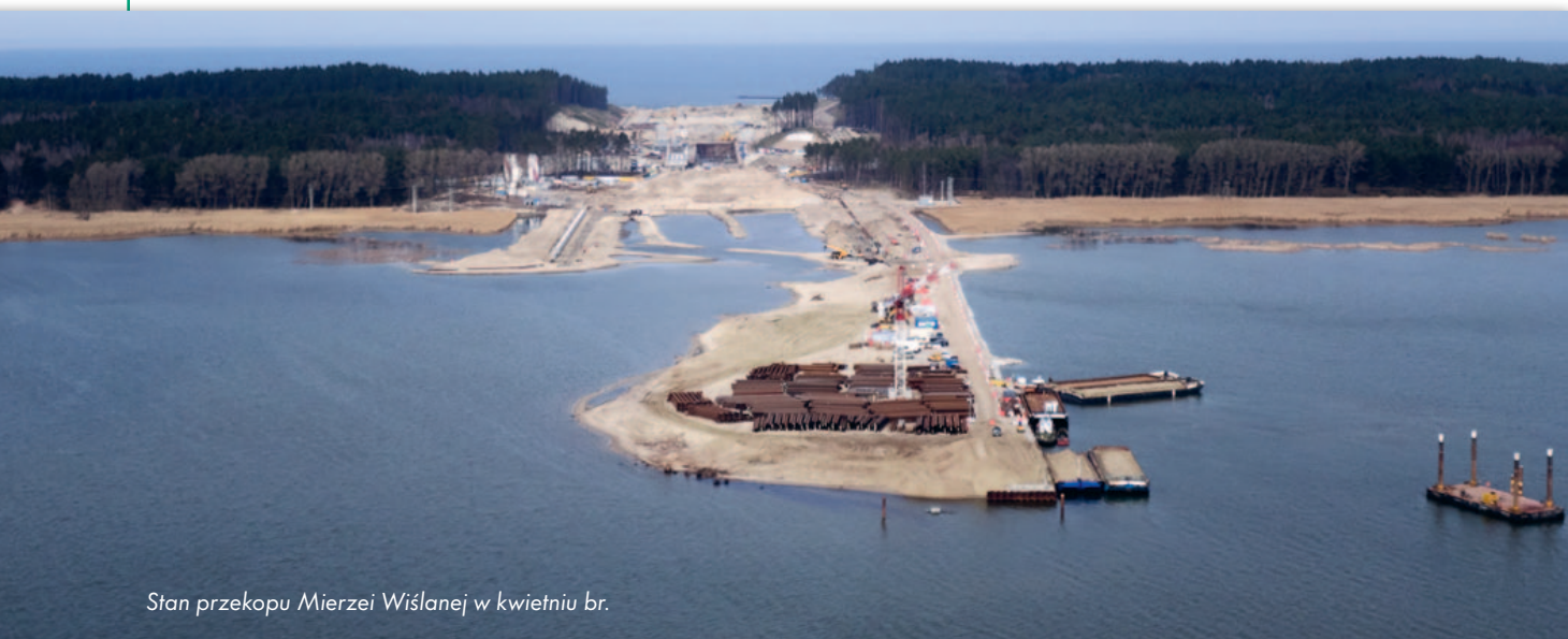
Stan przekopu Mierzei Wiślanej w kwietniu br.