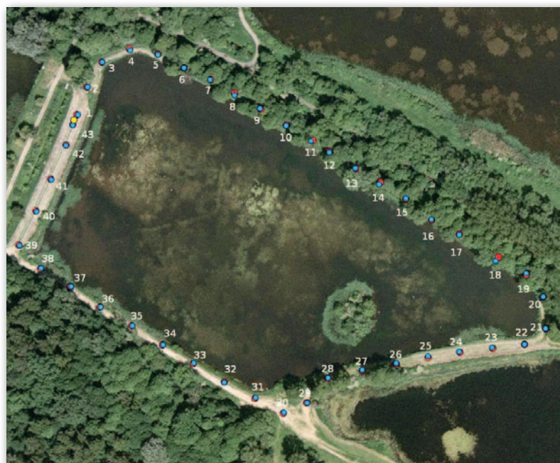
Rys. 3. Miejsca wyzwalania pomiarów w drugim teście na podkładzie ortofotomapy. Punkty niebieskie – pomiary uwzględniające Galileo i BeiDou; punkty czerwone – pomiary tylko GPS + GLONASS; punkt żółty – lokalizacja odbiorników bazowych