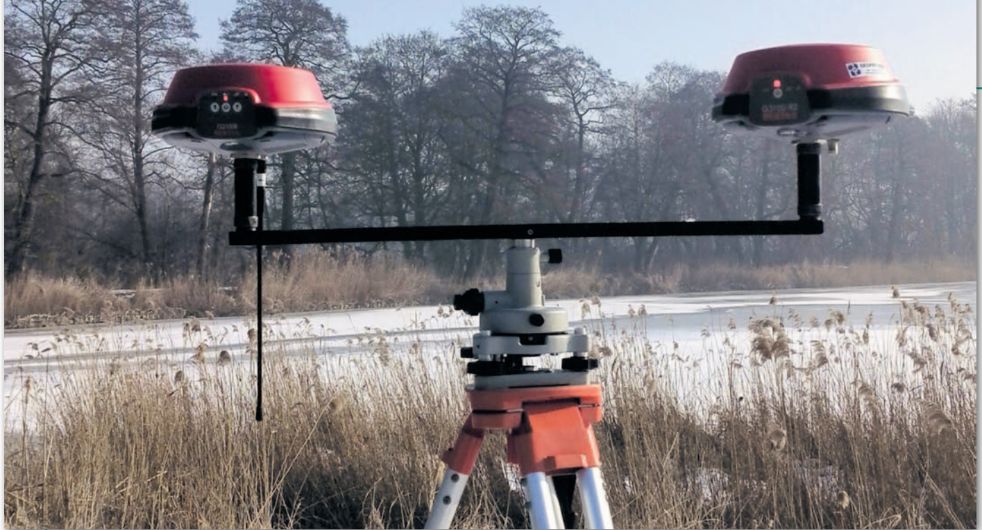
Rys. 1. Sposób mocowania na statywie dwóch odbiorników bazowych do celów testowych

Testy pomiarowe z użyciem dodatkowych systemów nawigacji