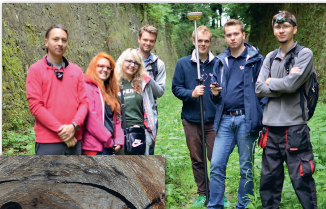
Uczestnicy Obozu Geodezyjnego w trakcie pomiaru z wykorzystaniem skanera Faro X330 oraz odbiornika GNSS Topcon Hiper SR

Pomiar technologią skaningu laserowego podziemnych korytarzy minerskich Twierdzy Kłodzko był celem obozu (7-11 lipca) zorganizowanego przez członków Studenckiego Koła Naukowego Geodetów „Agrimensor” działającego przy Zakładzie Geodezji i Ochrony Terenów Górniczych Politechniki Śląskiej.