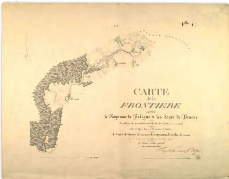
4. Mapa demarkacyjna granicy polsko-pruskiej od Nowego Dworu do Goli (odcinek od Nowego Dworu do Lubowidza), 1822 r., AGAD, Zb. Kart. 98-1, ark. 1

Prace demarkacyjne rozpoczęto w maju 1818 r. Kierujący czynnościami pomiarowymi i kartograficznymi Chrzanowski