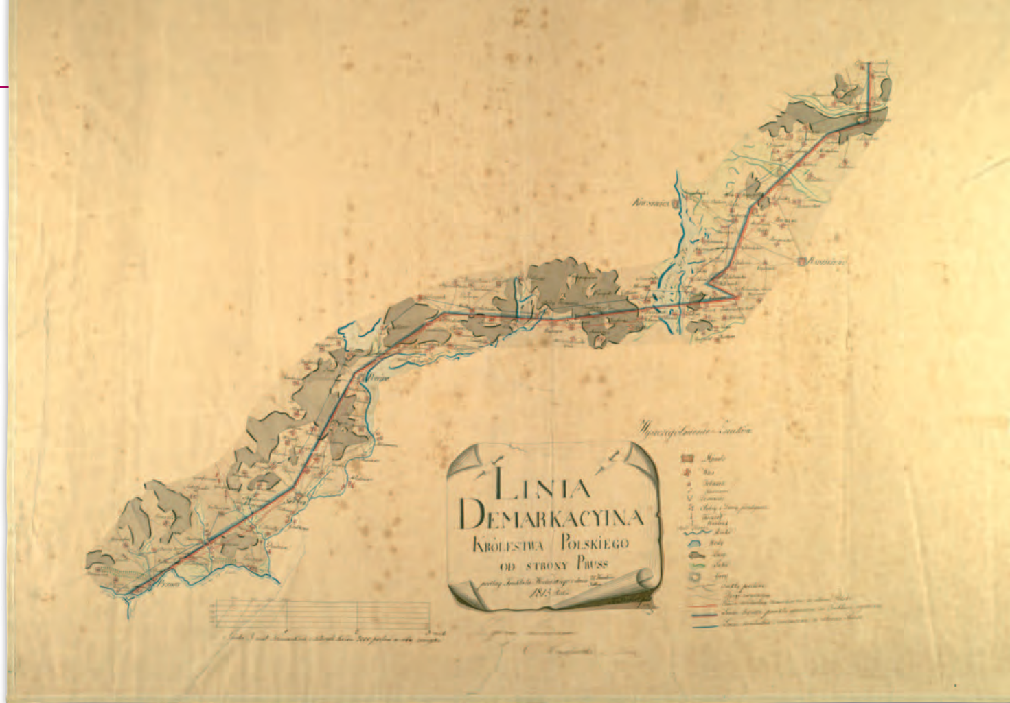
2. Mapa odcinka granicy polsko-pruskiej od wsi Opoczki do ujścia Prosnicy do Warty, po 1815 r., AGAD, Zb. Kart. 4-5

lestwa Polskiego i Rosji z Austrią będzie biegła wzdłuż linii granicznej sprzed 1809 r., co miało ułatwić prace demarkacyjne w tym rejonie. Wyjątkiem była konieczność wytyczenia granic Wolnego Miasta Krakowa przez komisję z udziałem delegacji państw zaborczych. Natomiast przeprowadzenie demarkacji Królestwa Polskiego z Prusami było trudniejsze, ponieważ ustalona w Wiedniu granica nie opierała się na żadnej wcześniejszej linii granicznej.