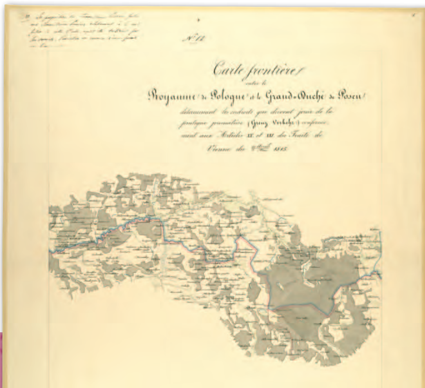
1. Mapa przedstawiająca propozycję komisarzy polskich przebiegu linii granicy polsko-pruskiej (odcinek od Nowego Dworu do Białkowa nad Drwęcą), po 1815 r., AGAD, Zb. Kart. 4-3, ark. 1

nak do rozstrzygnięcia pozostało jeszcze wiele kwestii spornych, a przede wszystkim wytyczenie granicy w terenie i ustalenie słupów granicznych. Umowy dotyczące Polski zawarte w Wiedniu oraz porozumienie w sprawie Wolnego Miasta Krakowa przewidywały powołanie komisji mieszanych, które miały dokonać demarkacji, przygotować mapy i opisy topograficzne granic. Konwencja rosyjsko-austriacka stanowiła, że granica Kró-