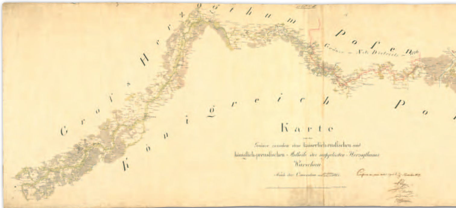
3. Mapa delimitacyjna granicy polsko-pruskiej do konwencji berlińskiej z 11 listopada 1817 r., AGAD, Zb. Kart. 4-4

sarzom pruskim przebiegu linii granicznej od Nowego Dworu koło Działdowa do miejscowości Gola koło Bolesławca w powiecie wieruszowskim zgodnie z artykułami 20 i 21 konwencji zawartej między Rosją i Prusami 3 maja 1815 r. w Wiedniu. Mapa ta, nieopatrzona nazwiskami autorów, najprawdopodobniej została sporządzona przez topografów wojskowych armii Królestwa Polskiego uczestniczących w czynnościach demarkacyjnych. Opracowano na niej tereny przygraniczne w pasie do 10 km (AGAD, Zb. Kart. 4-3, ark. 1-5) – ryc. 1 (ark. 1).