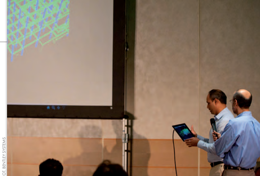
Pokaz możliwości aplikacji mobilnej dla iPada

Bentley nie spoczywa jednak na laurach i swój produkt systematycznie rozwija. Jedną z zapowiedzi ogłoszonych podczas BeInspired było opracowanie technologii do zapisu w oprogramowaniu ProjectWise tzw. i-modeli do formatu PDF. I-model to otwarty standard wymiany danych o infrastrukturze. Dzięki niemu można przysyłać trójwymiarowe, złożone modele i otwierać je w różnych aplikacjach, także konkurencyjnych. PDF – jak wynika z danych Bentleya – jest zaś najpopularniejszym formatem wymiany danych w środowisku ProjectWise. Dzięki połączeniu obu tych rozwiązań do przeglądania w 3D tzw. i-model enabled PDF wystarczy oprogramowanie Adobe Reader lub Acrobat oraz darmowa wtyczka ze