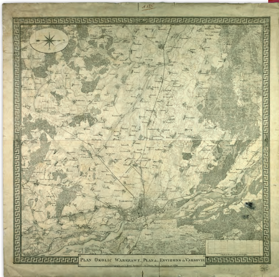
3. Plan Warszawy i okolic, 1829 r., AGAD, Zb. Kart. 86-4

Kształtowana w latach 1815-30 organizacja wojskowych służb topograficznych przetrwała powstanie listopadowe. Podczas wojny z Rosją zapotrzebowanie wojska polskiego w mapy powierzono Kwatermistrzostwu Generalnemu. Jednocześnie popełniono błąd, mianując kwatermistrzem generalnym