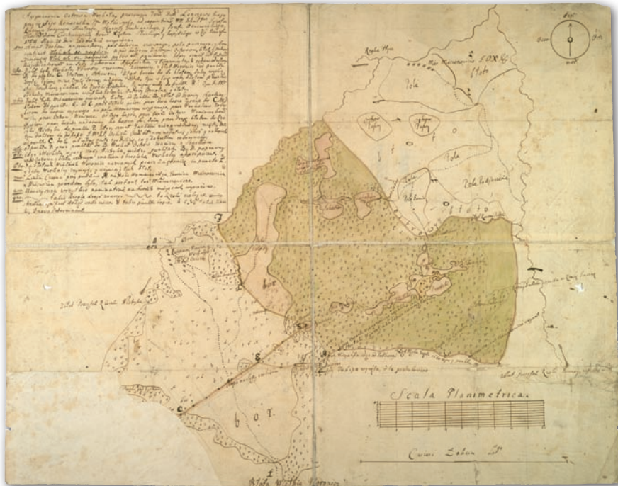
Rys. 6. Mapa wsi Wieszczerczowice i Werkały, 1754 r., AGAD, Zb. Kart. 446-39

nieje adnotacja, że została wykonana na polecenie sądu komisarzkiego i uwierzytelniona przez komisarza Pawła Popiela (AGAD, Zb. Kart. 507-7).