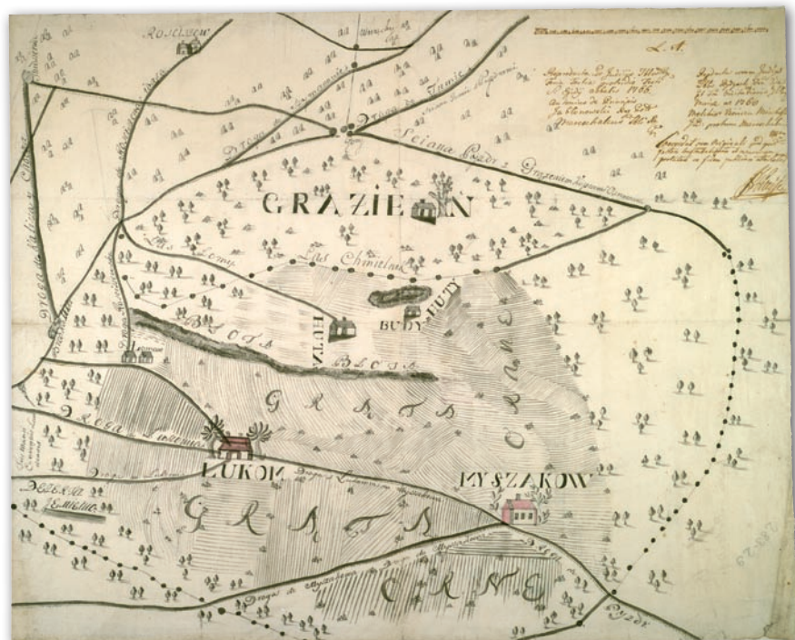
Rys. 4. Mapa dóbr łukom, 1766 r., AGAD, Zb. Kart. 283-29