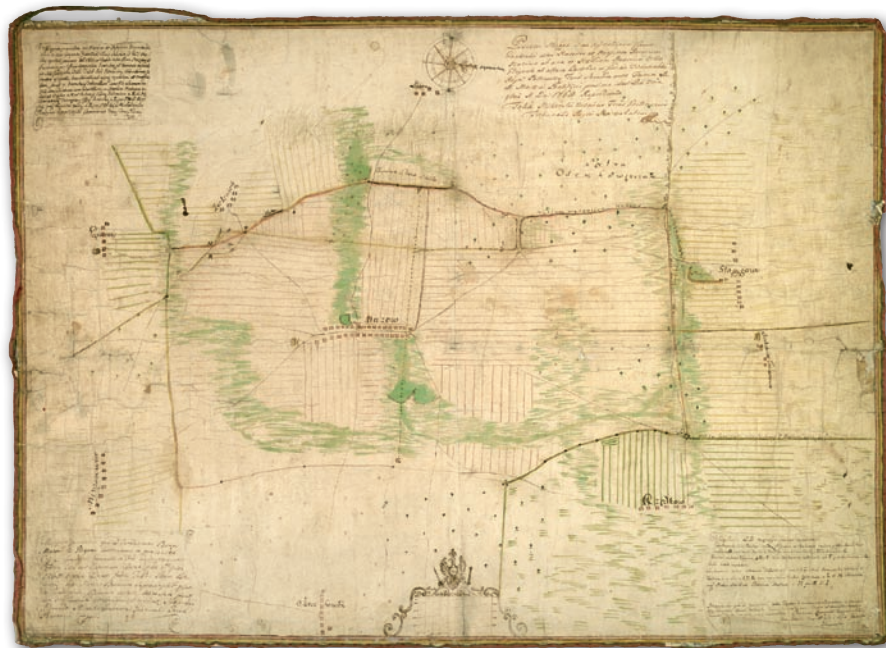
Rys. 1. Mapa sporu granicznego między dobrami Mazew, Głogowa i Jankowice, 1768 r., AGAD, Zb. Kart. 170-6

Adnotacje umożliwiają śledzenie losów sporu granicznego trwającego przez dłuższy czas. Wśród kartografików sądów asesorskich zachowały się dwie mapy dotyczące sporów granicznych toczonych przez miasto Latowicz z są-