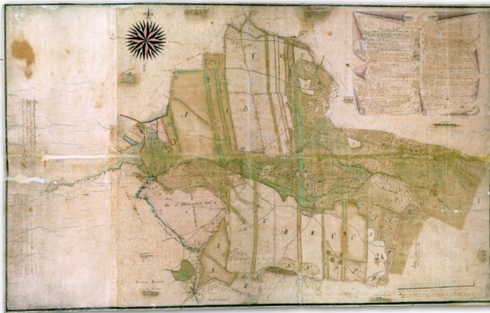
Rys. 2. Mapa granic Latowicza, 1782 r., AGAD, Zb. Kart. 241-16