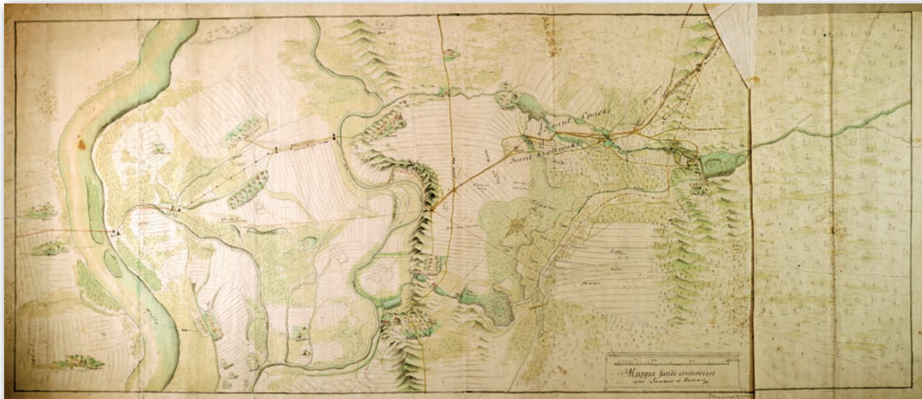
Rys. 7. Mapa sporu terytorialnego między dobrami należącymi do ekonomii Kozienice a dobrami Janików, 1755 r., AGAD, Zb. Kart. 507-2 (fragment)