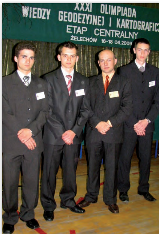
Laureaci II miejsca w klasyfikacji zespołowej w 2009 r.

W 1952 r. patronat nad szkołą objął Wojewódzki Zarząd Dróg Publicznych w Rzeszowie. W roku szkolnym 1956/57 wprowadzono 5-letnie technikum, które podlegało Ministerstwu Oświaty. Aby powiększyć bazę dydaktyczną szkoły, w ma-