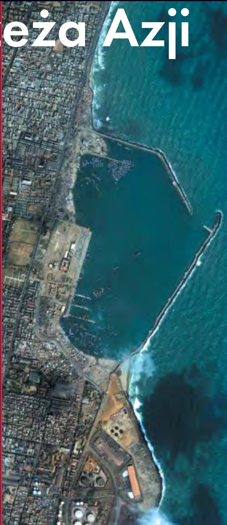
Miasto Madras w Indiach. Od lewej: 14 sierpnia 2002 r. i 29 grudnia 2004 r.