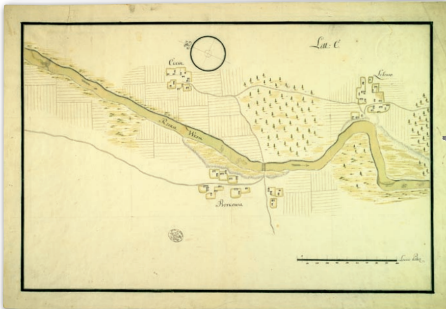
Rys. 1. Mapa trzech odcinków rzeki Wkry, 1776 r.

że mapy województw F. Czaykowskiego. AGAD posiada z tego pięć map rękopiśmiennych, jedną kopię, jedną mapę rytowaną. Niektóre z nich mają widoczną sygnaturę stanisławowską. Ponadto w AGAD znajdują się dwie mapy województw, które stanowią materiały zastępcze dla Zbioru Geograficznego Stanisława Augusta .