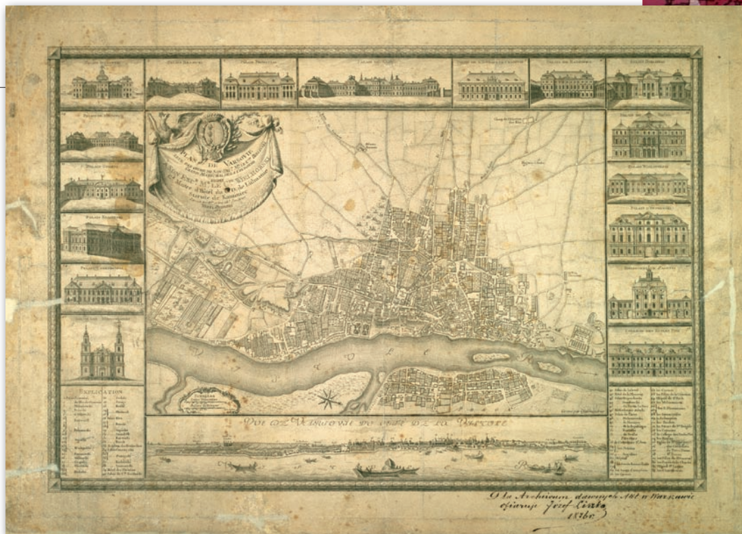
Rys. 4. Plan Warszawy, 1772 r. AGAD, Zb. Kart. 300-25