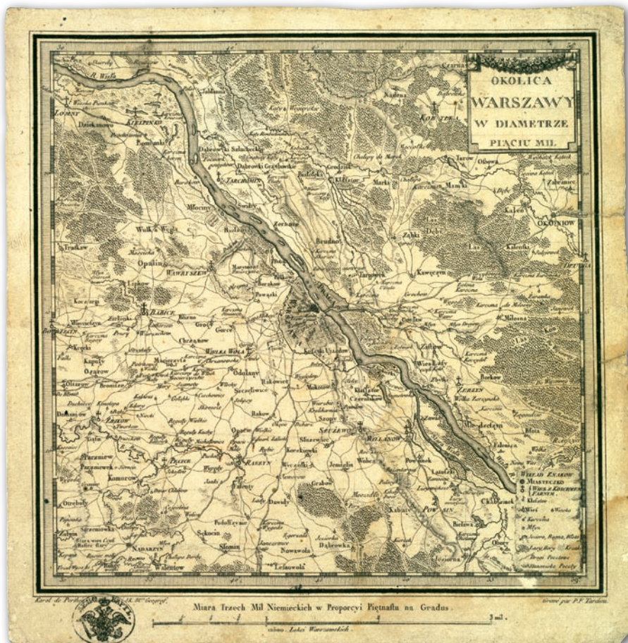
Rys. 5. Mapa okolic Warszawy w diametrze pięciu mil, 1786 r. (ryt. 1794 r.), AGAD, Zb. Kart. 69-22b