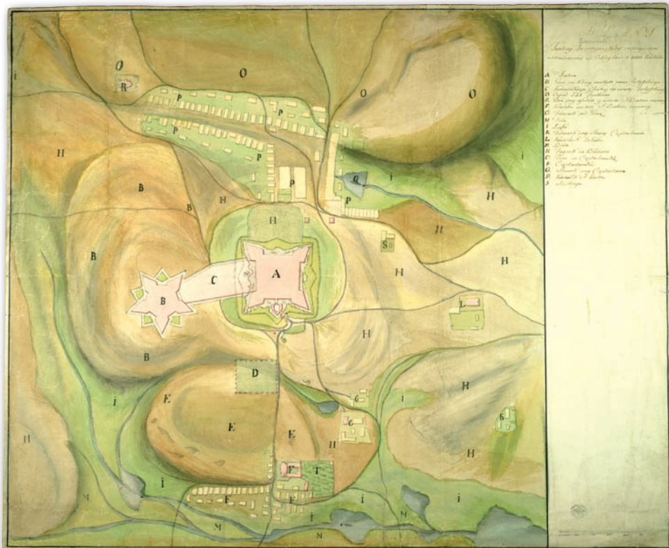
Rys. 3. Plan fortecy jasnogórskiej z projektem nowej fortyfikacji, 1789 r.