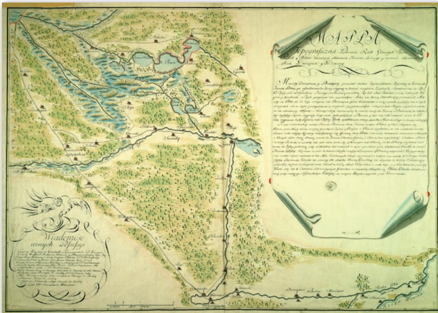
Rys. 2. Mapa Kanału Dniepr - Dźwina, 1784 r., AGAD, Zb. Kart. 96-2

sporządzono w Depo-Kart (1787-1812) – AGAD Zb. Kart. AK 127. Druga została wykonana przez nieznanego autora w końcu XVIII lub na początku XIX w. (AGAD, Zb. Kart. 96-1).