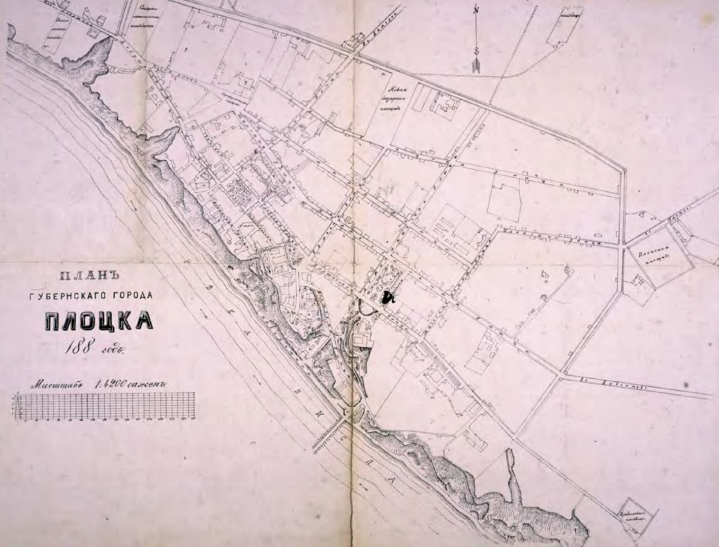
1. Plan miasta gubernialnego Płocka, [1881-1889 r.], AGAD, Zb. Kart. 302-51

kę wojskowych topografów rosyjskich. W latach 30., 40. i 50. XIX w. powstawały też mapy okolic miast polskich, najczęściej w skali od 1:20 000 do 1:40 000, na których miasta zaznaczone były w sposób uproszczony. Wśród tych map dominowały prace cząstkowe, tworzone dla potrzeb mapy topograficznej Królestwa Polskiego oraz dla celów wojskowych (głównie manewrów).