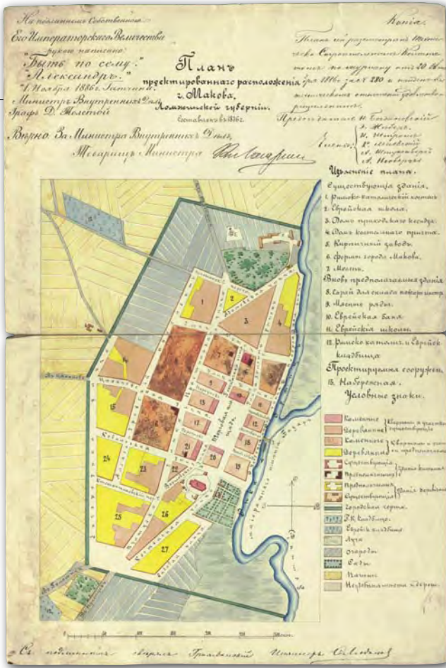
4. Plan regulacyjny miasta Makowa Mazowieckiego (kopia), 1876 r., AGAD, Zb. Kart. 302-31, ark. 3