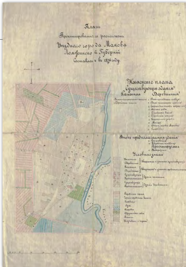
3. Plan regulacyjny miasta Makowa Mazowieckiego (pierworys), 1876 r., AGAD, Zb. Kart. 302-31, ark. 2

cimowicz. Natomiast od 11 lipca 1867 r. działał Specjalny Komitet do reorganizacji zarządu miast i gospodarki miejskiej przy Komitecie Urządzącym. W wyniku prac prowadzonych przez te wyspecjalizowane komórki od drugiej połowy 1864 r. przygotowano projekt ograniczenia liczby miast. Proponowano, aby pozbawieniu praw miejskich podlegały miasta: