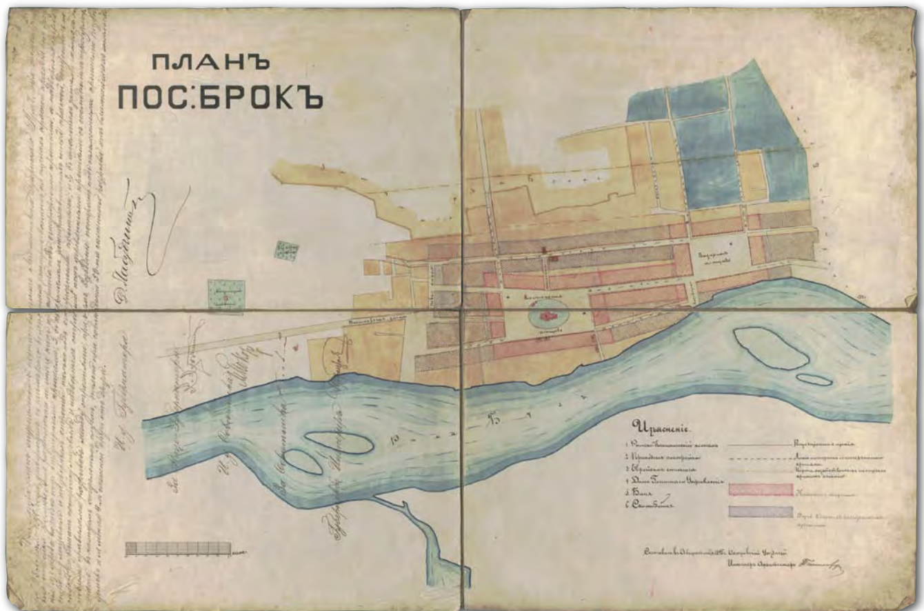
6. Plan regulacyjny osady Brok, 1895 r., AGAD, Zb. Kart. 302-38

podstawie którego wykonano w tym samym roku wersję przedłożoną do zatwierdzenia przez Ministerstwo Spraw Wewnętrznych i cara Rosji. Zachowana w zbiorach AGAD mapa jest kopią planu regulacyjnego, podpisanego 1 listopada 1876 r. przez cara Aleksandra II (AGAD, Zb. Kart. 302-31, ark. 3, ilustracja 4).