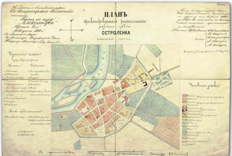
5. Plan regulacyjny miasta Ostrołki (kopia), 1886 r., AGAD, Zb. Kart. 302-29, ark. 2

W przypadku niektórych miast, między innymi Makowa i Ostrołki, zachowały mapy, które wyznaczały wówczas kolejne etapy powstawania planu regulacyjnego. Prace pomiarowe w Makowie zakończono przed 1876 r. i sporządzono plan sytuacyjny (AGAD, Zb. Kart. 302-31, ark. 1, ilustracja 2). W 1876 r. powstał pierworys planu regulacyjnego (AGAD, Zb. Kart. 302-31, ark. 2, ilustracja 3), na