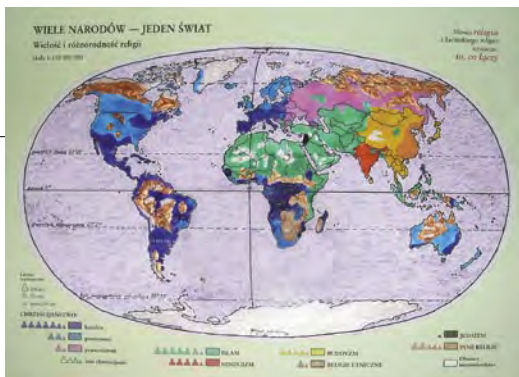
Kinga Gawrysiak, 11 lat