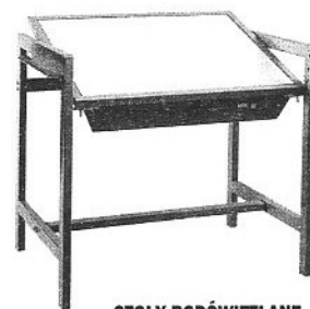
STÓŁY PODŚWIETLANE SZTYWNE I UCHYLNE