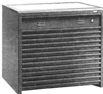
SZSM-B2/13 Szufladowiec z podświetlanym blatem