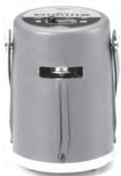
Nivelator laserowy LH500

Japońska firma SOKKIA w kooperacji z firmą Nissho wprowadziła na rynek nowe niwelatory laserowe LH500 i LV300. Są to instrumenty samopoziomujące w zakresie 5°.