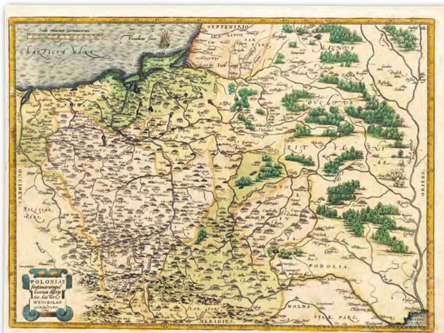
XVI-wieczna mapa Polski Wacława Grodeckiego „Poloniae finitimarumque locorum descriptio”, publikowana do 1592 roku w atlasie „Theatrum Orbis Terrarum” Abrahama Orteliusa

druków Jagiellonki znajduje się wydanie tego atlasu z 1613 roku z mapą Polonia et Silesia w skali 1:1 600 000. Egzemplarz ten był własnością Jana Brozka – wybitnego astronoma, profesora Akademii Krakowskiej, który założył katedrę geometrii praktycznej. Co ciekawe, na marginesach mapy zachowały się jego notatki.