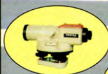
Niwelator samopoziomujący AL-180