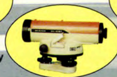
Niwelator samopoziomujący AI-240