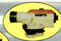
Niwelator samoogniskujący AFL-240