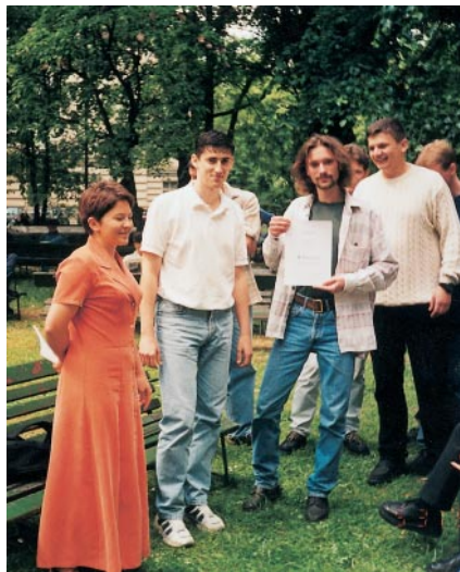
W środku zwycięski zespół

Wszystkie prace są ciekawe. Nie było łatwo wybrać zwycięzców. Zwracano uwagę nie tylko na wynik końcowy, ale i na cały prze-