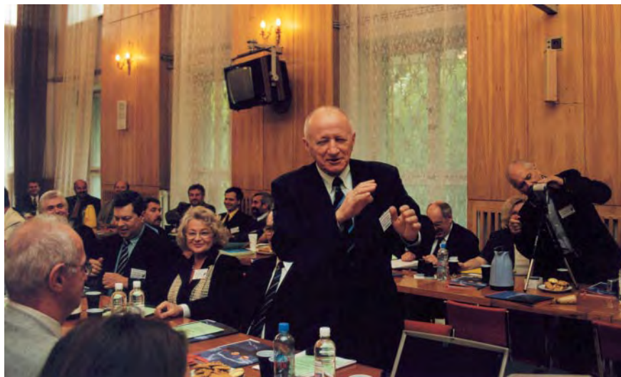
I Konferencja GIG i KZPFGiK

Czerwcowa konferencja GIG i KZPFGiK na temat samorządu zawodowego i bieżących problemów wykonawstwa geodezyjnego oraz posiedzenie PRGiK poświęcone zaopiniowaniu projektu nowelizacji Prawa geodezyjnego i kartograficznego w istocie dotyczyły tego samego: nadania nowego kształtu profesji geodezyjnej. Niewykluczone, że przyjęte rozwiązania na następnych kilka, czy kilkanaście lat wyznaczą nie tylko warunki działania, ale i rangę zawodu geodety. W dyskusjach ścierają się często sprzeczne interesy administracji rządowej i samorządowej, a także pozostającego w opozycji do całej administracji – wyko-