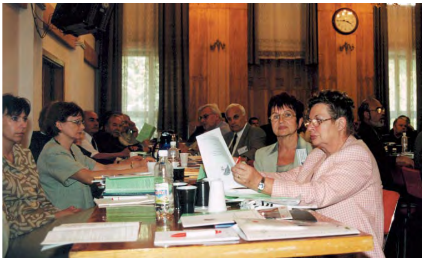
I Konferencja GIG i KZPFGiK

podarki zasobem geodezyjnym i kartograficznym, jak i samego zasobu, który GUGiK chciałby traktować jako całość stanowiącą istotny element struktury informacyjnej państwa. Zasób powinien być zorganizowany w sposób umożliwiający jego pełną aktualizację, zarządzanie i udostępnianie, a fundusz powinien zostać zachowany pomimo prób jego likwidacji.