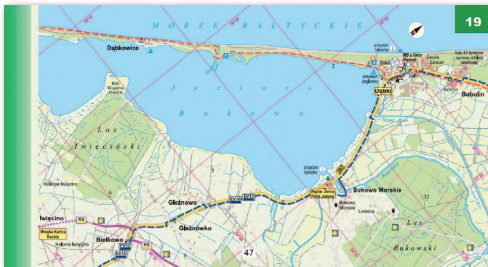
Najlepsza mapa turystyczna – „Wybrzeże Bałtyku. Atlas rowerowy” (Eko-Graf z Wrocławia)

Eko-Graf z Wrocławia. Werdykt obu tych gremiów okazał się zbieżny również w kategorii „Inne mapy i atlasy (drukowane)”. Tu zwycięzcą został „Atlas Karkonoszy. Atlas Krkonoš” (GEODETA 10/2021) wydany przez Karkonoski Park