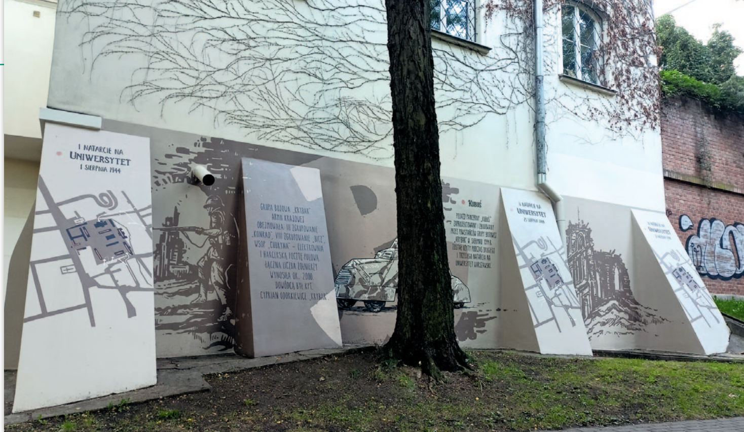
Elementem muralu są mapki przedstawiające działania Grupy „Krybar” podczas trzech prób opanowania kampusu w sierpniu i wrześniu 1944 r.