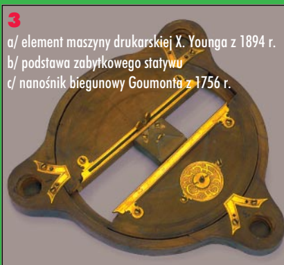
3 a/ element maszyny drukarskiej X. Younga z 1894 r. b/ podstawa zabytkowego statywu c/ nanośnik biegunowy Goumonta z 1756 r.