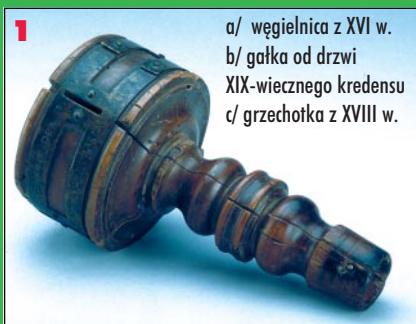
1 a/ węgielnica z XVI w. b/ gałka od drzwi XIX-wiecznego kredensu c/ grzechotka z XVIII w.

Rozwiązanie konkursu i nazwiska nagrodzonych opublikujemy w lutym w GEODECIE .