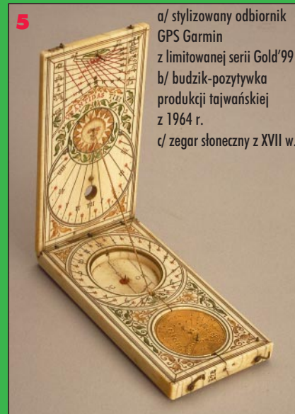
5 a/ stylizowany odbiornik GPS Garmin z limitowanej serii Gold'99 b/ budzik-pozytywka produkcji tajwańskiej z 1964 r. c/ zegar słoneczny z XVII w.