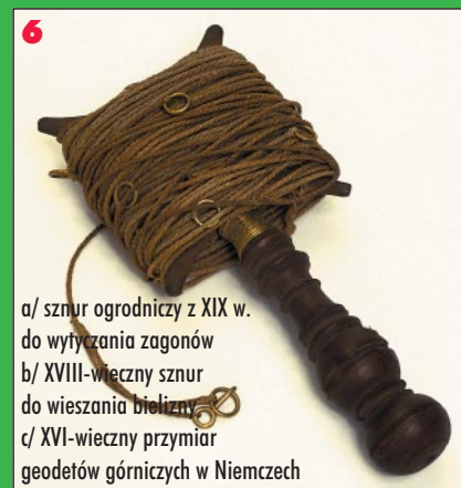
6 a/ sznur ogrodniczy z XIX w. do wytyczania zagonów b/ XVIII-wieczny sznur do wieszania bielizny c/ XVI-wieczny przyrząd geodetów górniczych w Niemczech