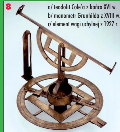
8 a/ teodolit Cole'a z końca XVI w. b/ manometr Grunhilda z XVIII w. c/ element wagi uchyłnej z 1927 r.