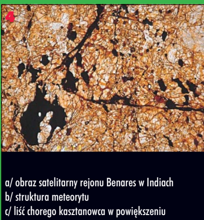
4 a/ obraz satelitarne rejonu Benares w Indiach b/ struktura meteorytu c/ liść chorego kasztanowca w powiększeniu