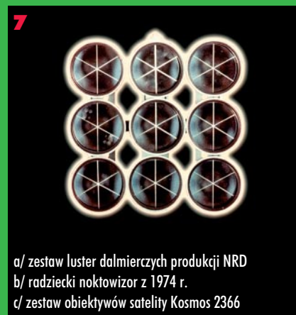
7 a/ zestaw lustek dalmierzyczych produkcji NRD b/ radziecki noktowizor z 1974 r. c/ zestaw obiektywów satelity Kosmos 2366