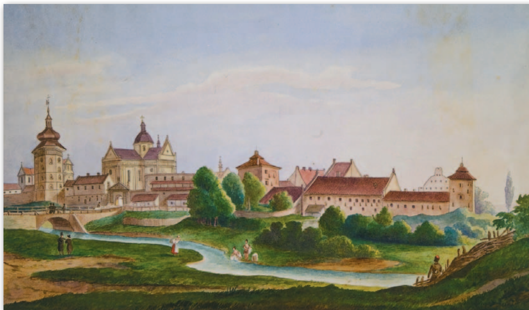
7. Panorama Żółkwi od strony zachodniej, II połowa XIX w., Atlas, t. 3, reprodukcja 2.5