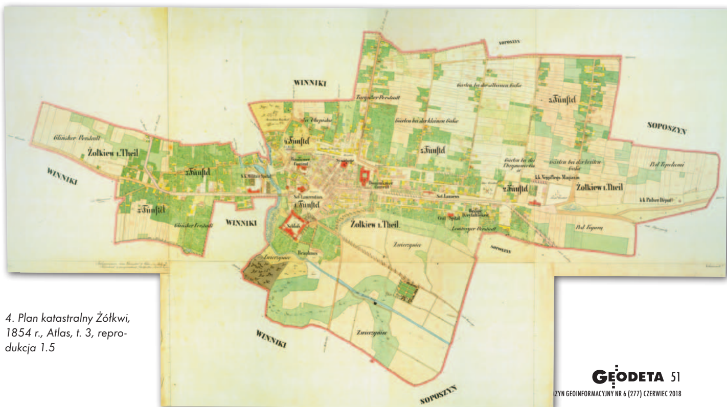
4. Plan katastralny Żółtkwi, 1854 r., Atlas, t. 3, reprodukcja 1.5