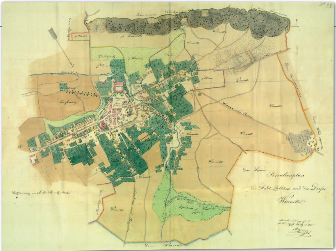
1. Plan Żółkwi i wsi Winniki, 1841 r., Atlas, t. 3, reprodukcja 1.3