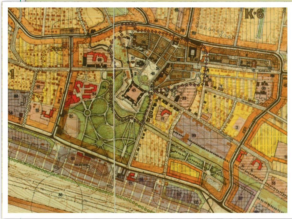
5. Plan generalny Żółkwi, 1997 r., Atlas, t. 3, reprodukcja 1.10. Poniżej fragment przedstawiający okolice zamku

doków – interesującej panoramy Żółkwi od strony zachodniej (ryc. 7). Akwarelę o wymiarach 27 x 16 cm wykonał w drugiej połowie XIX w. nieznanemu autorowi.