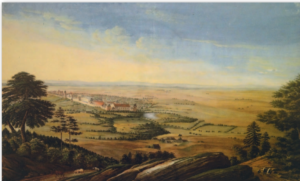
6. Panorama Żółkwi, 1826 r., Atlas, t. 3, reprodukcja 2.1

osadnictwo w okresie od XI do XVI w., grody z X-XIII w. i miejsca pochówków. Na drugim z kartografików autorzy przedstawili lokalizację fortyfikacji Żółkwi z XVI-XVIII w. Trzecia mapa autorska to przetworzony plan katastralny miasta z 1854 r. z dodaną legendą zawierającą objaśnienia użytych na niej barw i znaków. Kolejne opracowanie przedstawia budowle sakralne Żółkwi od końca XVI do początku XXI w. Ostatnia mapa ukazuje rozwój przestrzenny miasta. Barwami oznaczono na niej: granice zabudowy miasta w XVII w. i XVIII w., zasięg miasta do I wojny światowej, zabudowę wsi Winniki w momencie przyłączenia jej do Żółkwi w ostatniej ćwierci XIX w. Ponadto kolorowymi liniami wykreślono przebieg granic administracyjnych miasta w okresie: austriackim, sowieckim i współczesnym.