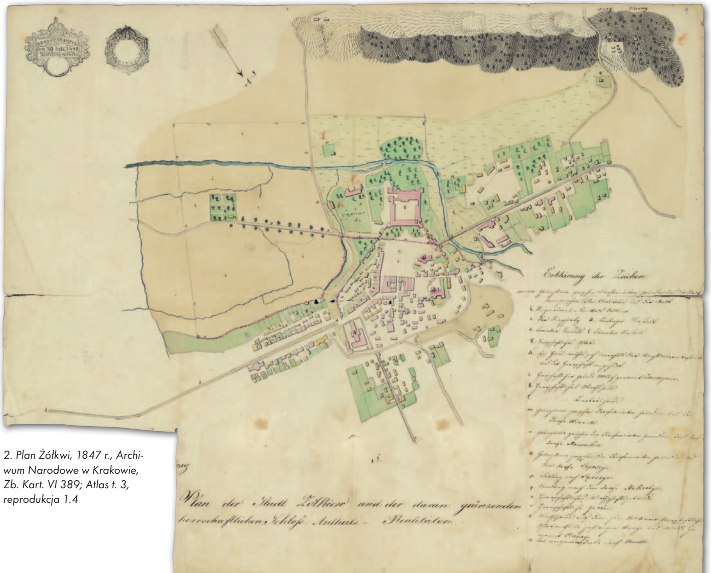
2. Plan Żółkwi, 1847 r., Archiwum Narodowe w Krakowie, Zb. Kart. VI 389; Atlas t. 3, reprodukcja 1.4