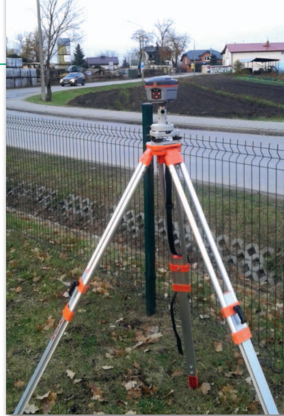
Rys. 2. Miejsce przeprowadzania testów

Drugi etap polega natomiast na kalibracji czujników magnetycznych. Magnetometr musi dokonać pomiarów lokalnego pola magnetycznego, dlatego podczas kalibracji przez ok. pół minuty należy powoli obracać odbiornik wokół jego trzech osi. Tak skalibrowany instrument jest gotowy do pomiarów w technologii Tilt Surveying.