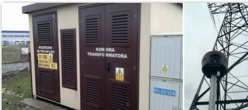
Rys. 3. Miejsce o dużych zakłóceciach pola elektromagnetycznego

Również ten test nie wykazał błędów spowodowanych przebywaniem w pobliżu obiektów mogących zakłócać lokalne pole elektromagnetyczne. Wskazuje to na dużą odporność systemu na takie zakłócenia. Nie należy jednak tego problemu bagatelizować – zalecamy zachowanie szczególnej ostrożności w takim „niebezpiecznym” terenie – np. poprzez wykonanie pomiaru dla kilku wychyleń tyczki.