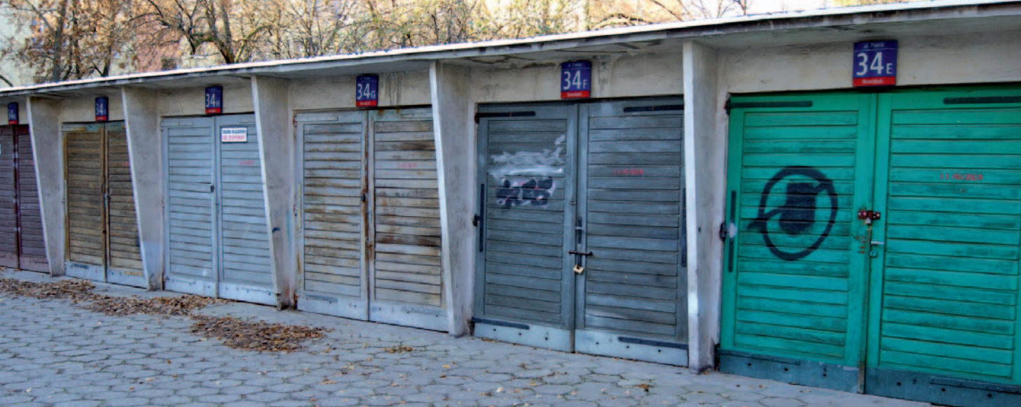
Rys. 4. Zanumerowane boksy garażowe na warszawskiej Woli

częściej prywatnym). Istnieje wprawdzie przepis, że rada gminy może nadawać im nazwy (ustawa o drogach publicznych art. 8 ust. 1a [1985]), ale potrzebne są w tej kwestii usprawnienia, bo w praktyce nie jest najlepiej. Bez zgody wszystkich właścicieli nazwy ulicom nie mogą być nadawane i z tego względu często zachodzi konieczność nadawania numerów od ulic znacznie oddalonych, co prowadzi do dziwnych sytuacji, jak ta z warszawskiego Wilanowa przedstawiona na rys. 3. Wszystkie widoczne numery adresowe dotyczą tam ulicy Prymasa Augusta Hłonda, a w praktyce są od samej ulicy znacznie oddalone.