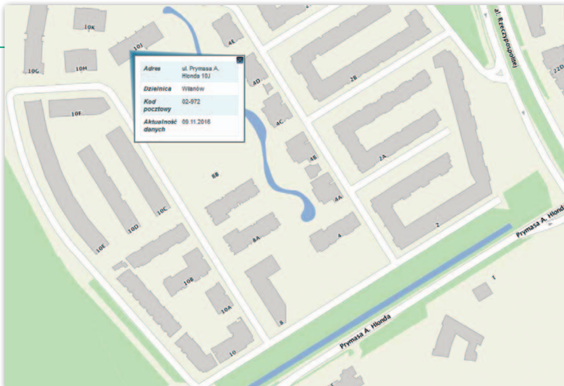
Rys. 3. Przykład numeracji budynków przy ul. Hłonda w Warszawie

Już w [2013] autorzy artykułu alarmowali, że ewidentnym nieporozumieniem jest pojawienie się w rozporządzeniu ws. ewidencji miejscowości, ulic i adresów § 5 ust. 1 stanowiącego, iż numery porządkowe „ustala się w procesie zakładania ewidencji, a w uzasadnionych przypadkach także w procesach jej aktualizacji”. Zapis taki wprost sugeruje, że z góry musimy założyć całą ewidencję i przewidzieć rozwój zabudowy na kilkadziesiąt lat wprzód, bo w przeciwnym razie grozi nam konieczność uzasadniania ewentualnych zmian jako czynności o charakterze niemal specjalnym. Ma to niebagatelne znaczenie, gdyż rocznie przybywa w Polsce kilkadziesiąt tysięcy nowych adresów. Co do istoty funkcjonowania ewidencji numeracji porządkowej, dotychczasowe przepisy były w tej kwestii nad wyraz spójne – ewidencję numeracji porządkowej stosowne organy zakładały i prowadziły na bieżąco z uwzględnieniem pojawiających się nowych numerów porządkowych – zarówno w 1950, 1968, jak i 2004 r. – co było słuszne i odzwierciedlało naturalny stan rzeczy. Konieczne jest więc usunięcie zapisu sugerującego, że ewidencja adresów jest zakładana raz, z uwzględnieniem wszelkich prognoz i później zmieniania w specjalnym trybie.