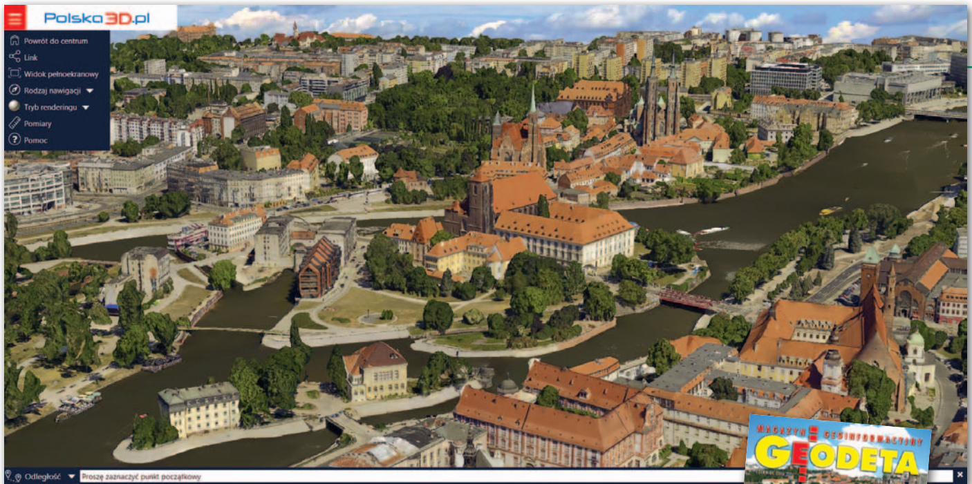
Wyspa Piasek, Wrocław 3D