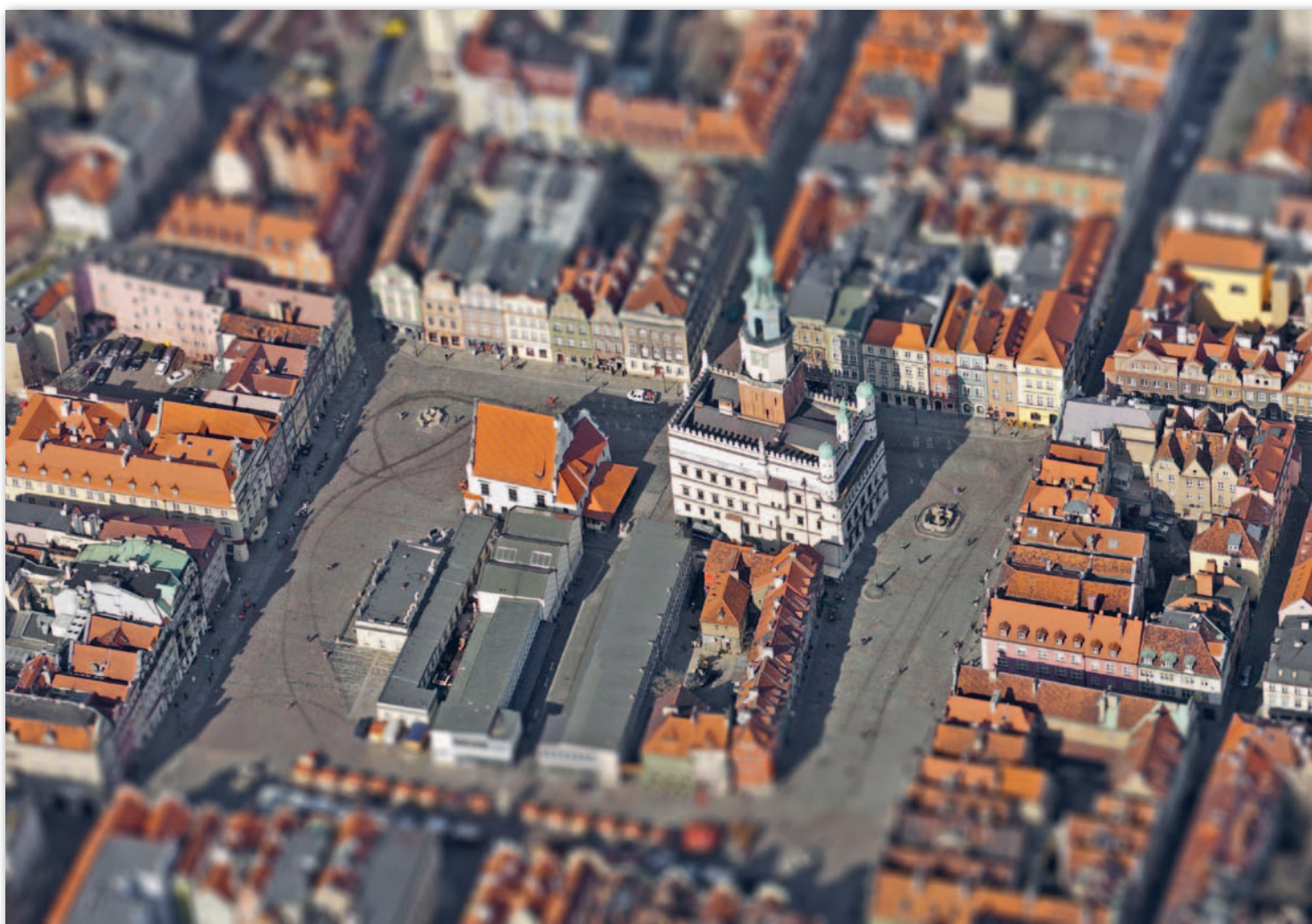
Stary Rynek w Poznaniu – zdjęcie ukośne z efektem tilt-shift (zmienioną głębią ostrości)