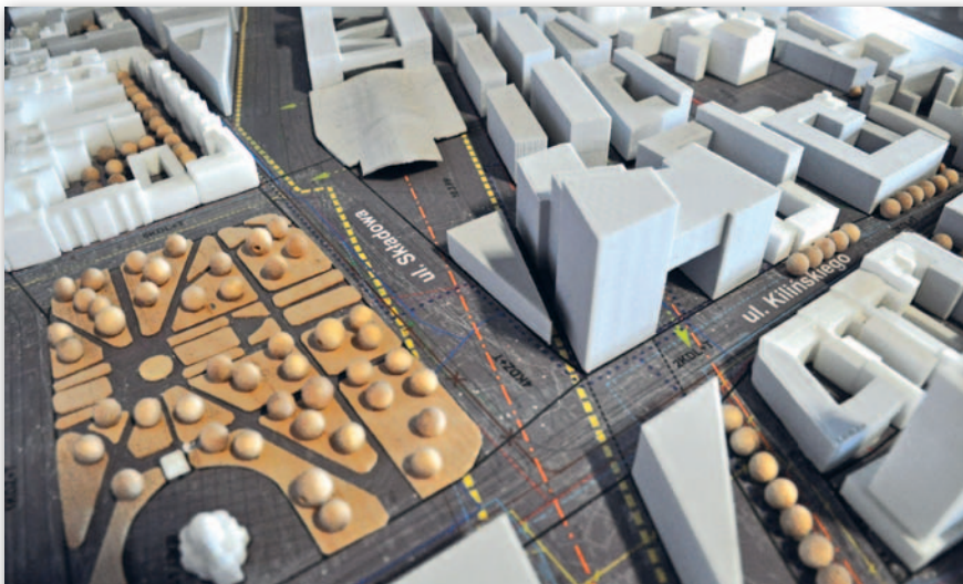
Makieta Nowego Centrum Łodzi

Żaden projekt, nawet tak prosty jak produkcja ortofotomapy, nie może być nadmiernie rozciągnięty w czasie, gdyż w przeciwnym razie już na etapie dosta-