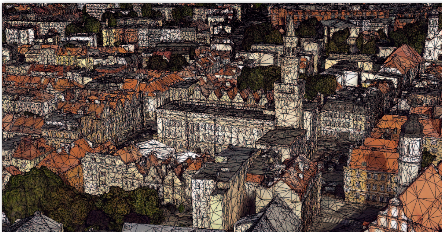
Ratusz w Opolu – model 3D, siatka trójkątów z teksturami