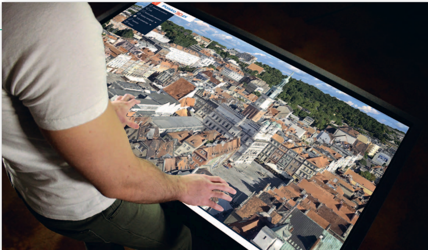
Stół dotykowy z aplikacją Polska3D.pl

wy produkt prezentuje nieaktualne dane. Opisywane w mediach przypadki błędów na mapach powodziowych wynikały m.in. z wykorzystania nieaktualnych danych wysokościowych. Równolegle rośnie świadomość użytkowników takich map zarówno wśród przedsiębiorców, jak i mieszkańców. Niemal każdy użytkownik internetu potrafi sprawdzić informację na wielu mapach jednocześnie. Wieloźródłowość danych przestrzennych daje ogromne możliwości i żadna mapa nie jest traktowana jako jedyny punkt widzenia.