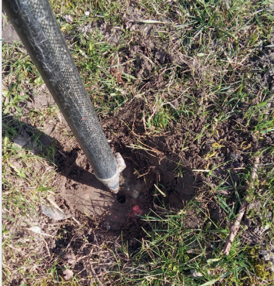
Punkt osnowy, na którym zostały wykonane pomiary bez uprzedniego uzyskania licencji

dezi i kartografii. Jego zdaniem w okresie przed wejściem w życie nowelizacji Pgik z 2014 r. dane i materiały były wydawane do konkretnego zgłoszenia prac, co potwierdzano stosownymi klauzulami nadającymi im cechy dokumentu. Natomiast wykorzystanie ich do innego opracowania nie było sankcjonowane z uwagi na odmienny sposób pobierania opłat. Sytuacja wykorzystania danych pobranych przed 12 lipca 2014 r. do pracy geodezyjnej, która była wykonana po tym dniu, mogła mieć miejsce tylko w sytuacji przejściowej, tj. kontynuacji pracy geodezyjnej do