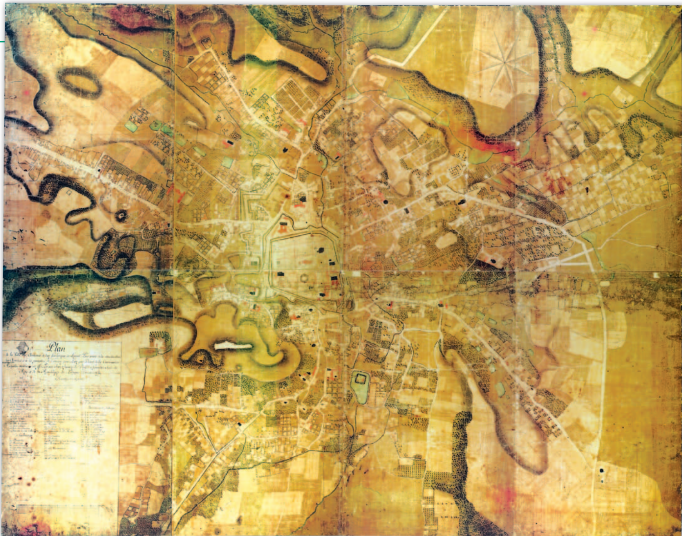
3. Mapa wielkoskalowa Lwowa i terytoriów przedmiejskich, 1766 r., Jean Ignace du Desfilles, Atlas, reprodukcja 1.3

w skali 1:2500, sporządzona techniką wielobarwną. Ponadto obowiązkowo powinny być: współczesna mapa w skali 1:5000 lub 1:10 000, XIX-wieczna mapa przedstawiająca miasto i jego okolice w skali od 1:25 000 do 1:100 000 oraz wielobarwna mapa autorska ukazująca rozwój przestrzenny miasta w skali 1:5000. Towarzyszyć ma im opracowanie zawierające najważniejsze informacje dotyczące dziejów miasta, a szczególnie rozwoju przestrzennego. Ten podstawowy zestaw materiałów tworzących każdy z zeszytów często jest wzbogacony przez opracowania autorskie dotyczące struktury społecznej danego miasta, jego funkcji gospodarczych, kulturalnych i religijnych, a także przez publikowanie najstarszych map i widoków miast.