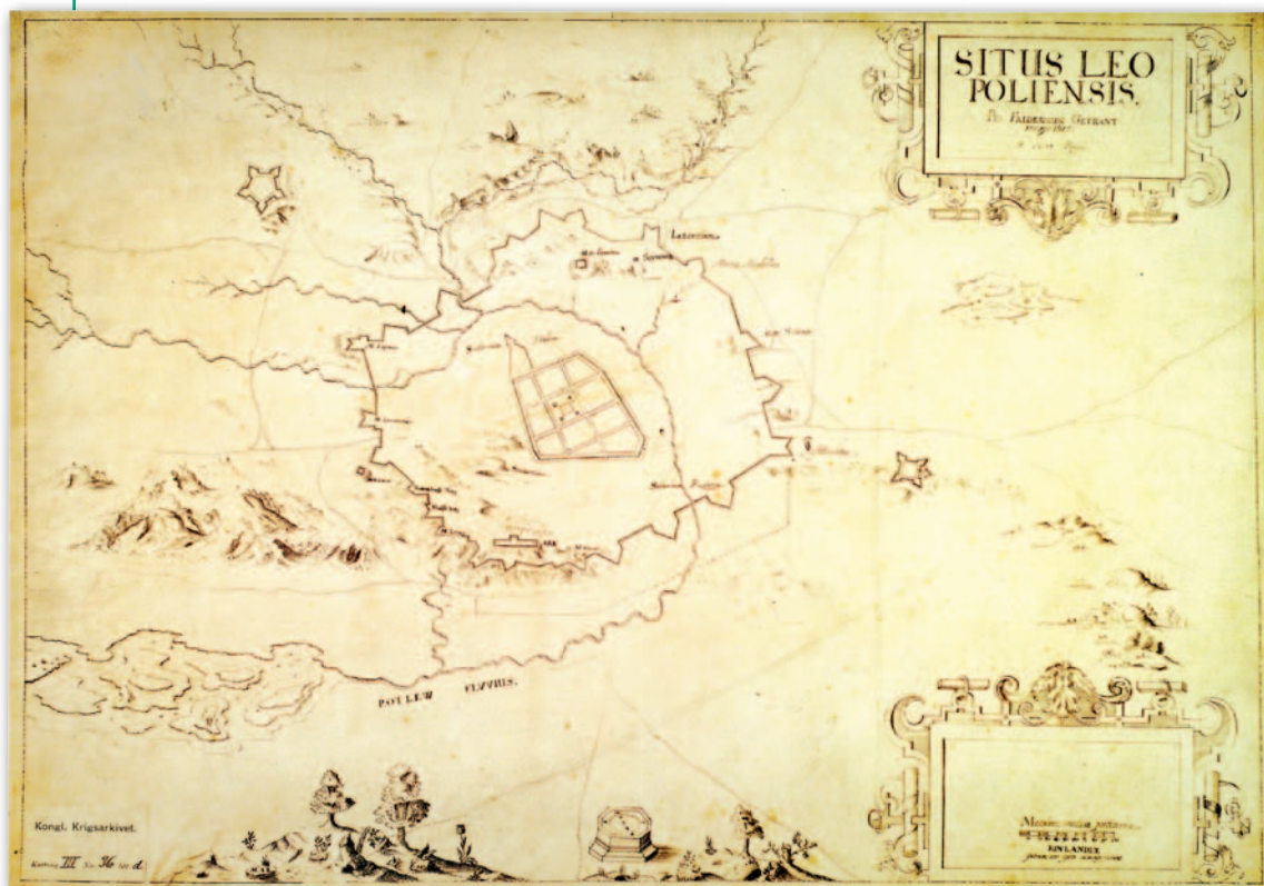
2. Mapa wielkoskalowa Lwowa z naniesionym projektem fortyfikacji, 1635 r., Fryderyk Geikant, Atlas , reprodukcja 1.1

Podstawowym celem edycji atlasów historycznych miast jest utworzenie kartograficznej bazy źródłowej do badań porównawczych nad dziejami miast europejskich. Według norm przyjętych przez Międzynarodową Komisję Historii Miast główną mapę każdego zeszytu powinna stanowić mapa pomiarowa z okresu przedindustrialnego