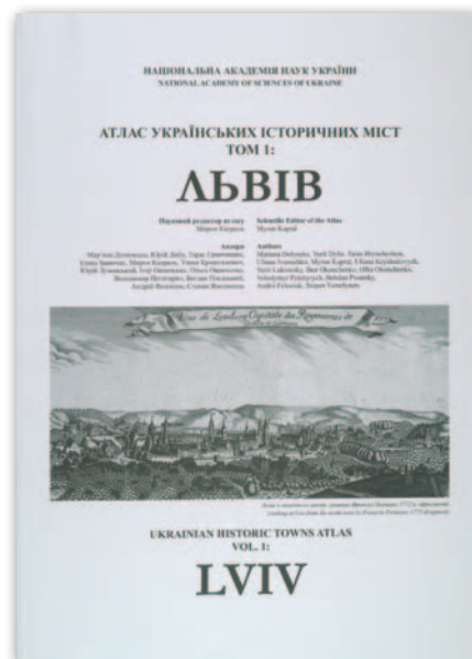
1. Strona tytułowa opracowania tekstowego atlasu Lwowa