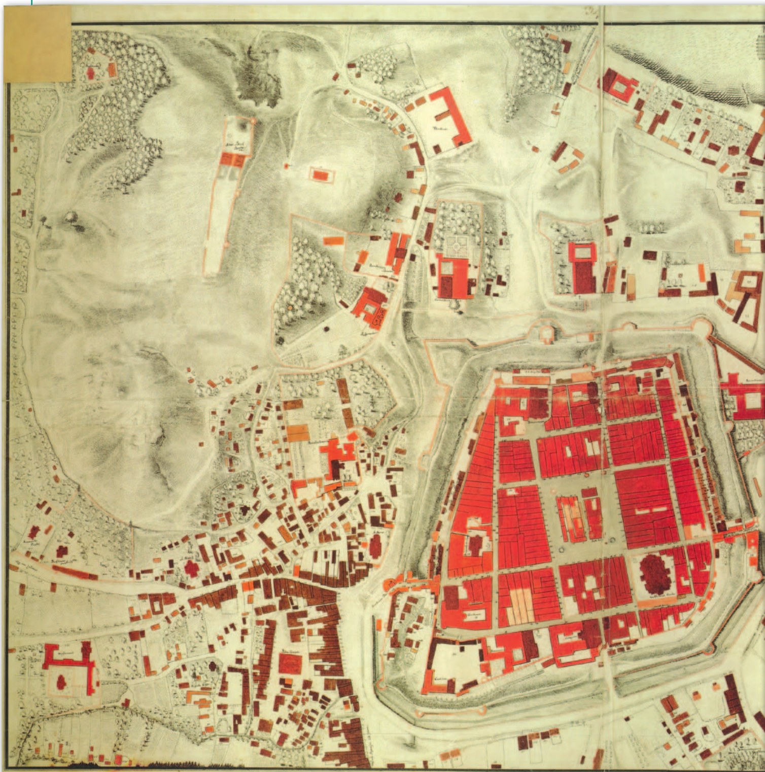
4. Mapa wielkoskalowa Lwowa, 1777 r., Joseph Daniel de Huber, Atlas, reprodukcja 1.5

fortecznych. Mapę zatytułowaną Situs Leopolitensis sporządzono w skali około 1:12 700 na karcie pergaminowej o wymiarach 62,8 x 44,5 cm (według katalogu Cartographica Poloniae 1570-1930 ; natomiast według autorów atlasu Lwowa, którzy podają najpierw wysokość, a następnie szerokość: 44 x 63 cm). Miasto przedstawiono na niej w granicach projektowanych przez Getkanta nowożytnych fortyfikacji. Oznaczono sieć