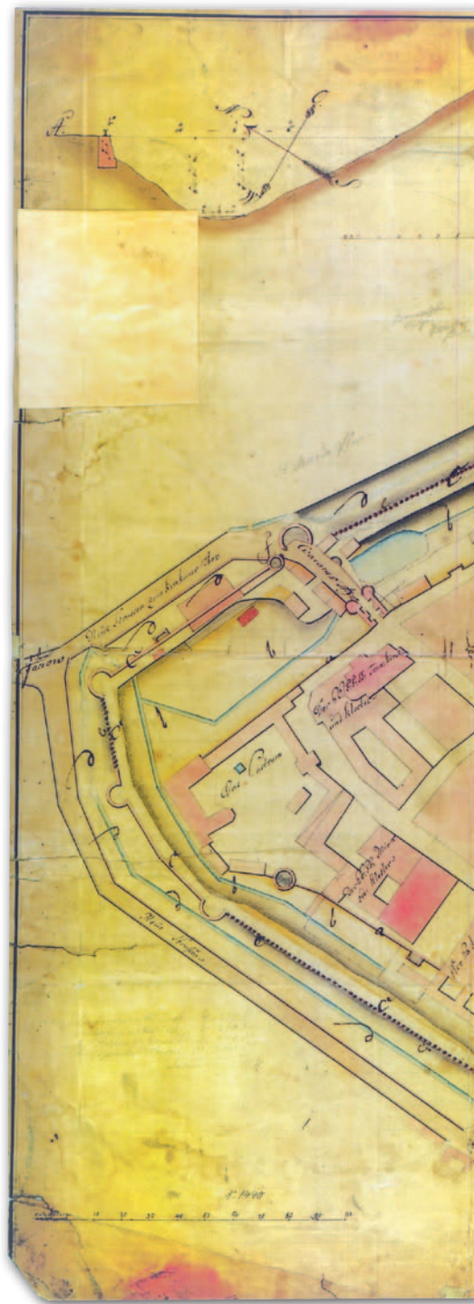
5. Mapa wielkoskalowa Lwowa w granicach murów miejskich i przedmieścia Halickiego, 1780 r., Franz d'Ertel, Anton von Pinterhofen, Atlas , reprodukcja 1.7

W Atlasie zamieszczono także reprodukcje 6 widoków Lwowa. Publikowanie materiałów ikonograficznych w edycji źródeł kartograficznych do dziejów miast europejskich,