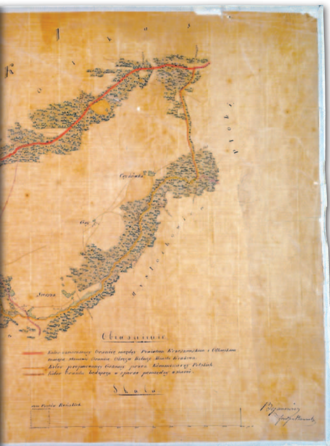
2. Mapa części granicy Wolnego Miasta Krakowa zawierająca projekt zmian proponowanych przez komisarzy polskich, [1816-1817 r.], rękopis, AGAD, Zb. Kart. 4-22

Na zachowanych trzech arkuszach mapy demarkacyjnej granica z Królestwem Polskim biegła od Wisły w okolicach wsi Wyciąże (dzisiaj część dzielnicy Krakowa – Nowej Huty) potokiem Kościelnickim 10 km na północ, następnie między Wąsowem a Czulicami zmieniła bieg na północno-zachodni i dalej biegła wzdłuż linii usytuowanej na południe od Pietrzejowic, Luborzycy, Pielgrzymowic, Szyc, Będkowic, Raclawic, Gorenicy, Niesułowic, Biskupiego Boru, a następnie Białą Przemszą do Jęzora. Na tej granicy ustawiono 189 słupów. Pierwszy arkusz obejmuje odcinek od Modlnicy do Radwanowic – słupy graniczne 85-126 [AN Krak., WMK 474, ark. 1]. Na drugim wyrysowano odcinek od Ostrejnicy do Czyżówki – słupy graniczne 145-160 [AN Krak., WMK 474, ark. 2]. Trzeci