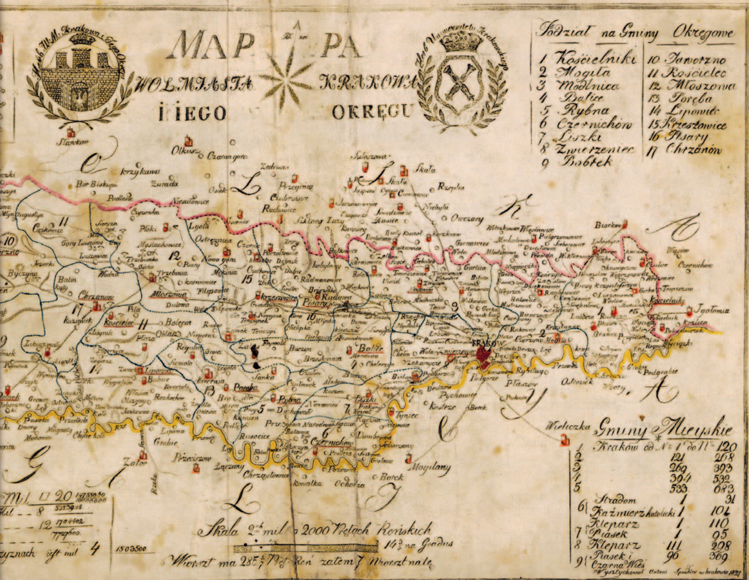
1. Mapa Wolnego Miasta Krakowa, 1827 r., druk ręcznie barwiony, AN Krak., WMK, 477