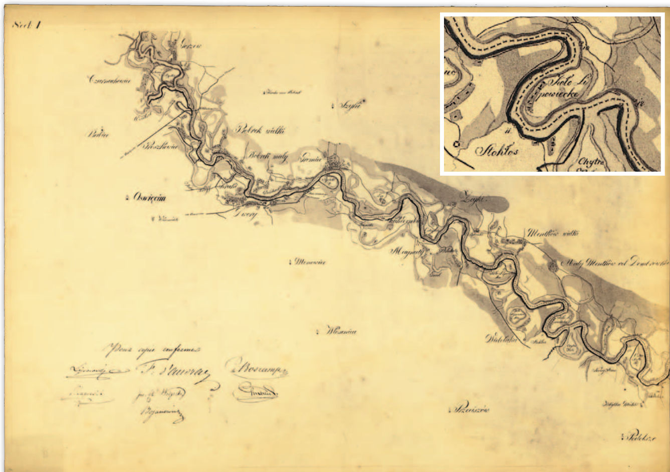
4. Mapa demarkacyjna odcinka granicy krakowsko-austriackiej między Gorzowem i Nowym Stawem, 1818 r./1843 r., odbitka ozalidowa, b.d., AN Krak., WMK, 4741, ark. 1. Na powiększeniu widoczne słupy nr 10-12

W zbiorach kartograficznych Archiwum Narodowego w Krakowie zachowało się 12 map ogólnych Wolnego Miasta Krakowa, niektóre z nich w więcej niż jednym egzemplarzu [AN Krak., WMK 475, 476, 477, 480, 481, 482, 483, 484, 485, 486, 487, 488]. Mapy terytorium Rzeczypospolitej Krakowskiej znajdują się także w zbiorach muzeów i bibliotek, przede wszystkim Muzeum Historycznego Miasta Krakowa, Biblioteki Jagiellońskiej i Biblioteki Narodowej w Warszawie. Dwie spośród map przechowywanych w Archiwum Narodowym w Krakowie to dzieła rękopiśmienne [AN Krak., WMK 475, 476], które są jednocześnie najstarszymi zachowanymi mapami ogólnymi Wolnego Miasta Krakowa. Pierwsza z wielobarwnych map (77 x 51 cm) została sporządzona w 1824 r. w skali około 1:94 000. Umieszczonego na niej podpisu auto-