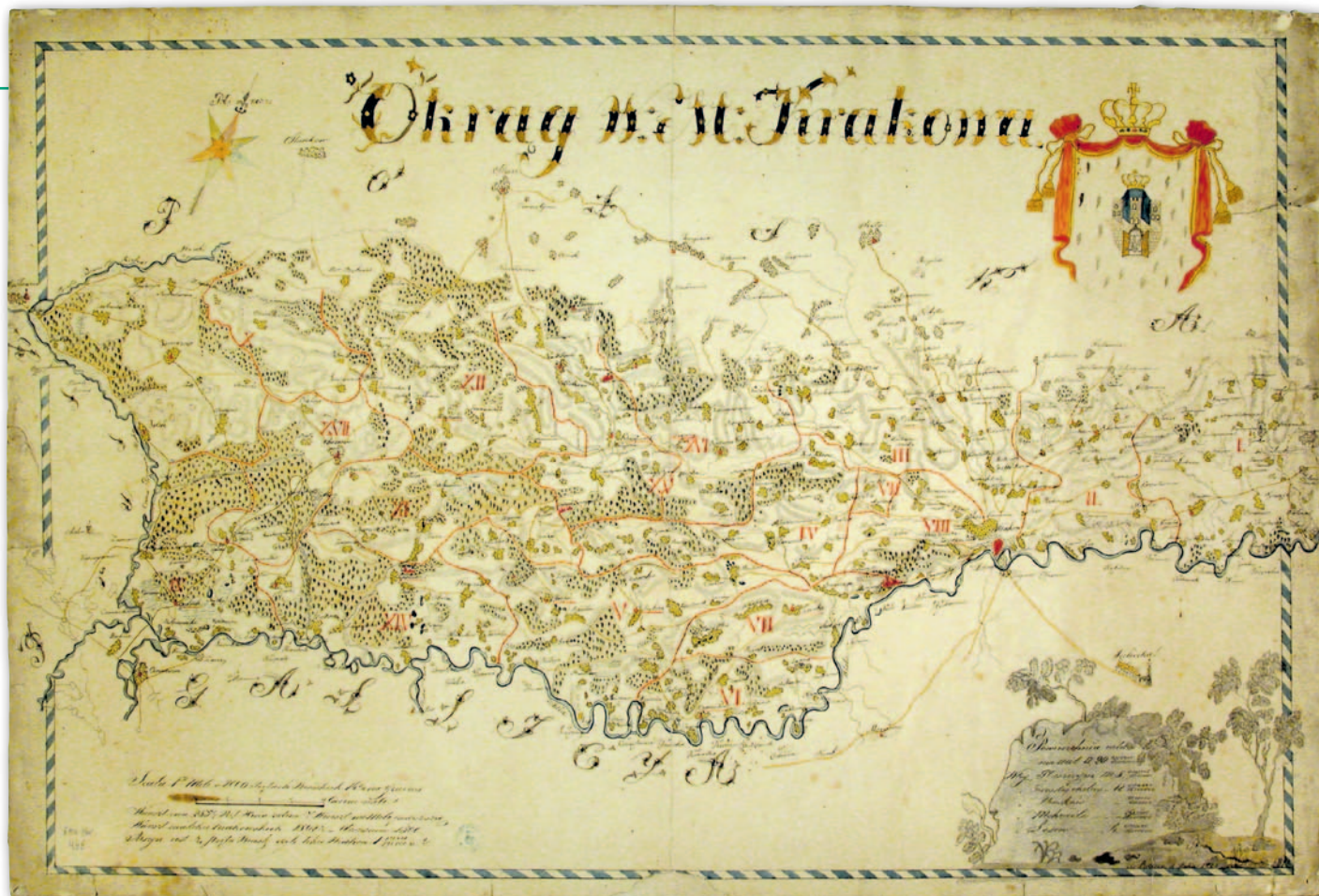
5. Mapa Wolnego Miasta Krakowa, 1824 r., rękopis, AN Krak., WMK, 476

ra nie udało się odczytać. Na mapie tej oznaczono granice „państwa krakowskiego” oraz granice 17 gmin okręgowych [AN Krak., WMK 476 – ryc. 5].