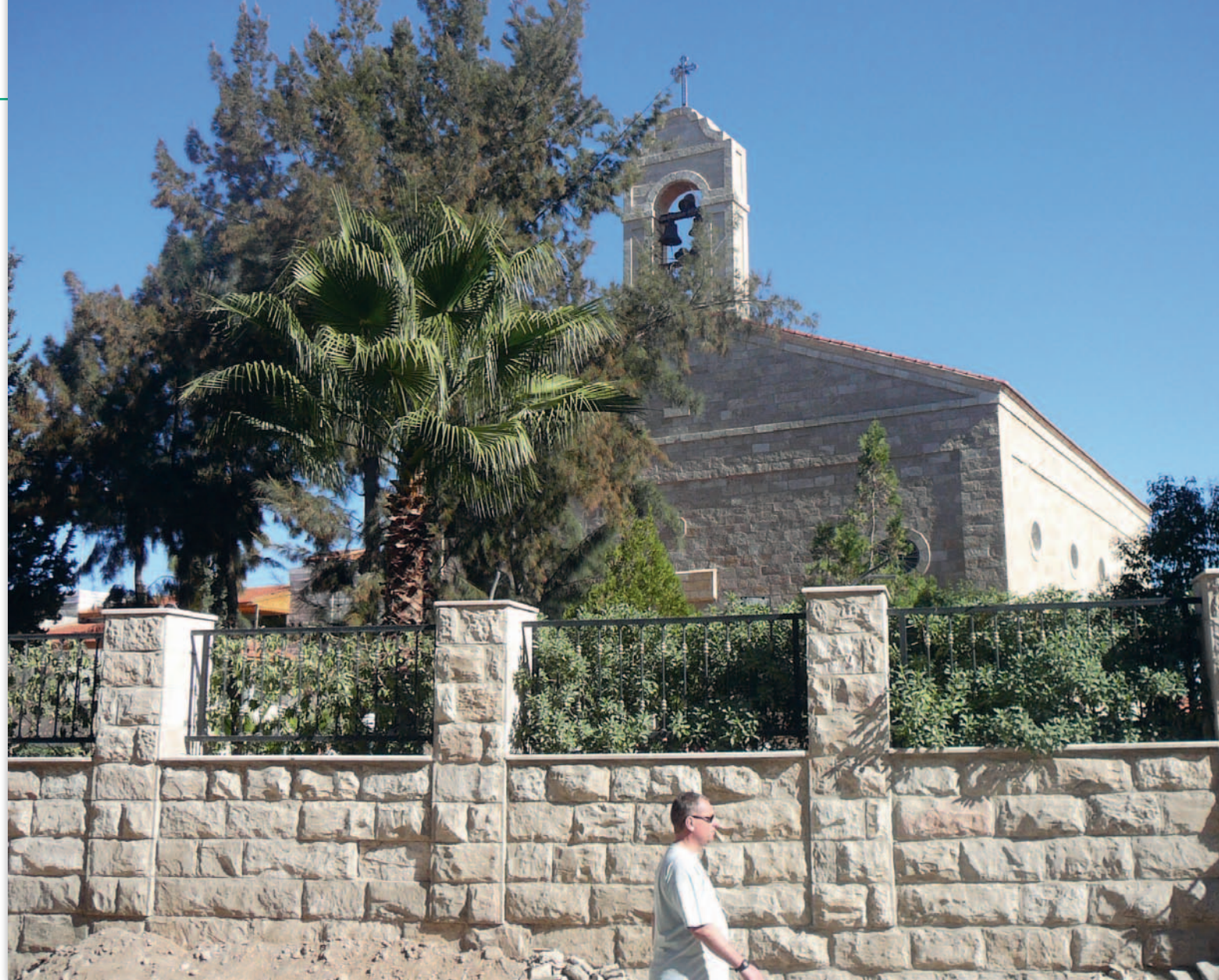
Grecko-prawosławny kościół św. Jerzego w Madabie (Jordania), w którym znajduje się mapa mozaika