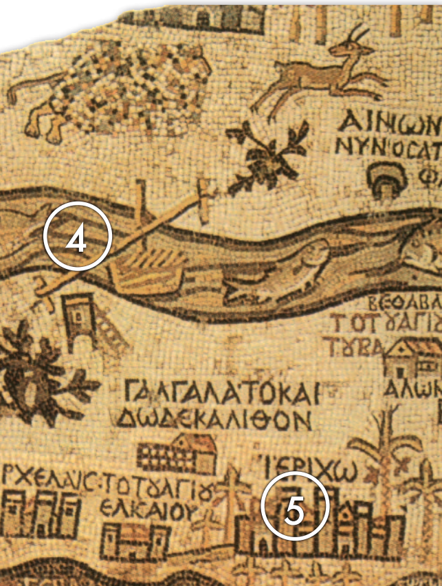
Gazela uciekająca przed lwem po wschodniej stronie Jordanu, w którym pływają ryby. Poniżej otoczone palmami Jerycho

dzibą biskupstwa, rozpoczęto budowę kilku kościołów. Najwspanialszy okres rozwoju miasta nastąpił za panowania cesarza Justyniana (527-565). Do VI w. w świątyniach powstawały cenne mozaiki. W 614 roku Madaba weszła w skład imperium perskiego.