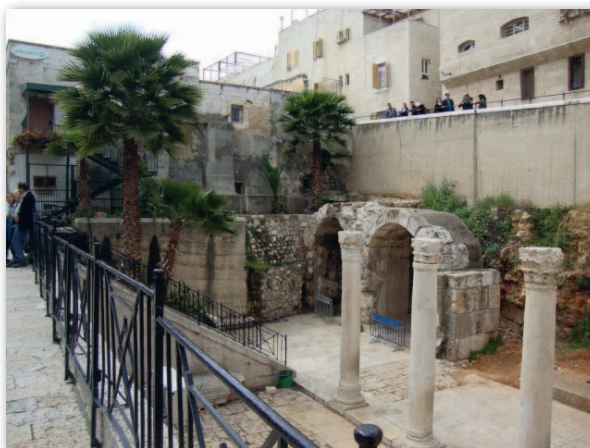
Jerozolima, kolumnada wzdłuż Cardo Maximus przedstawiona na mozaice z Madaby

Środkową część mapy zajmują rzeka Jordan i Morze Martwe. Rzeka pokazana jest na stosunkowo krótkim odcinku, mianowicie od Anion położonej w pobliżu Salem (dwóch biblijnych miejscowości, gdzie Jan Chrzciciel udzielał chrztu) do ujścia do Morza Martwego. Bardzo plastycznie zaznaczone są dwa miejsca przepraw przez rzekę. Poniżej drugiej przeprawy na uwagę zasługuje rysunek prawdopodobnie wieży obserwacyjnej z drabiną. Na wodzie widać trzy ryby – jedna płynie w kierunku morza, a dwie w kierunku przeciwnym. Morze Martwe pokazane jest prawie na całej długości, brakuje jedynie zniszczonej zachodniej części akwenu. Na tafli jeziora artyści przedstawili dwie łodzie wiozące ładunki. Na jednej z nich widać maszt żaglowy oraz dwa wiosła. Postacie żeglarzy zostały zniszczone prawdopodobnie w związku z wpływami ikonoklazmu, zachowały się jedynie dolne partie nóg. Podobnie potraktowano drugą, mniejszą łódź oraz jej wiosłarzy. Po