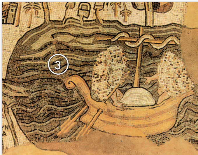
Morze Martwe z łodzią, z której usunięto sylwetki wiosłarzy w związku z wpływami ikonoklazmu

W dolnej części mozaiki ocalały dwa fragmenty tworzące swojego rodzaju półwyspy. Na pierwszym z lewej znajduje się fragment miasta bez opisu. Jest to z pewnością biblijne Jabneel położone na granicy Judy (Joz 15,11), zwane też Jabne (2 Krn 26,6), a w czasach hellenistycznych Jamnia. Na końcu drugiego ocalałego cypla widać fragment miasta Aszdod z kościołem i kilkoma budynkami. Na południe od Aszdod zachował się fragment mozaiki tworzący pewnego rodzaju enklawę. Widoczna jest na nim tylko część miasta Aszkelon, będącego jednym z pięciu miast Pentapolisu Filistynów. Autorzy mozaiki pokazali odcinek murów z trzema wieżami oraz z bramą od strony wschodniej. Na zachód od bramy leży duży plac obramowany dwiema ulicami z kolumnadą. W zachodniej części miasta widoczna jest inna główna ulica o przebiegu północ-południe. W północno-wschodniej części miasta pokazano kilka budynków.