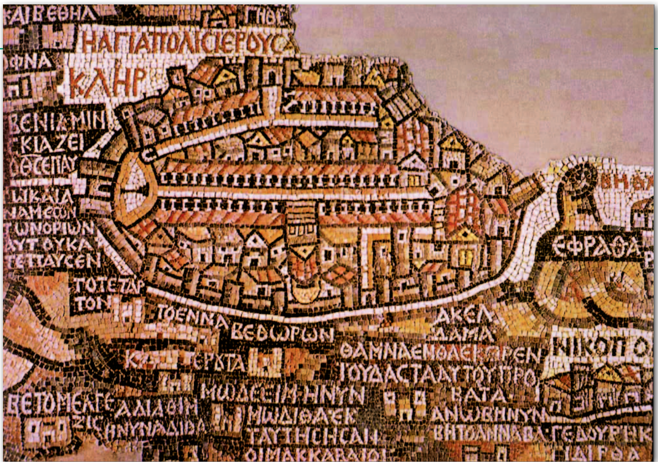
Jerozolima z widoczną kolumnadą biegnącą wzdłuż głównej ulicy Cardo Maximus od Bramy Damasceńskiej do bramy Syjonu

miasta (po lewej stronie mozaiki) do bramy Syjonu znajdującej się w części południowej (po prawej stronie mozaiki).