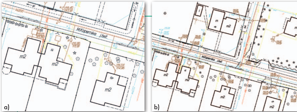
Rys. 3. Ilustracja wydruku w skali: a) 1:500 i b) 1:750

wyżej skal, ale np. 1:600, 1:750 czy nawet 1:856, bo w takiej skali oczekiwany fragment terenu będzie się akurat mieścił na papierze o danym formacie. Czasami ważniejsze jest bowiem przedstawienie czegoś w mniejszej skali, ale w całości, niż trzymanie się kurczowo zadanej skali i prezentacji na kilku kartkach papieru. A drobne odbieganie skali wydruku od skali redakcyjnej (optyczne zmniejszenie) nie powoduje jeszcze pogorszenia czytelności mapy, co przedstawiono na rys. 3.