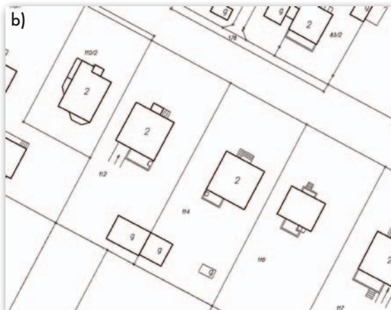
Rys. 4. Obraz mapy zasadniczej (a) i mapy ewidencyjnej dla tego samego fragmentu miasta (b)