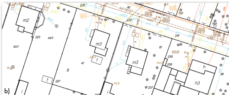
Rys. 1. Prezentacja graficzna a) bez znaków umownych i redakcji, b) pełna prezentacja