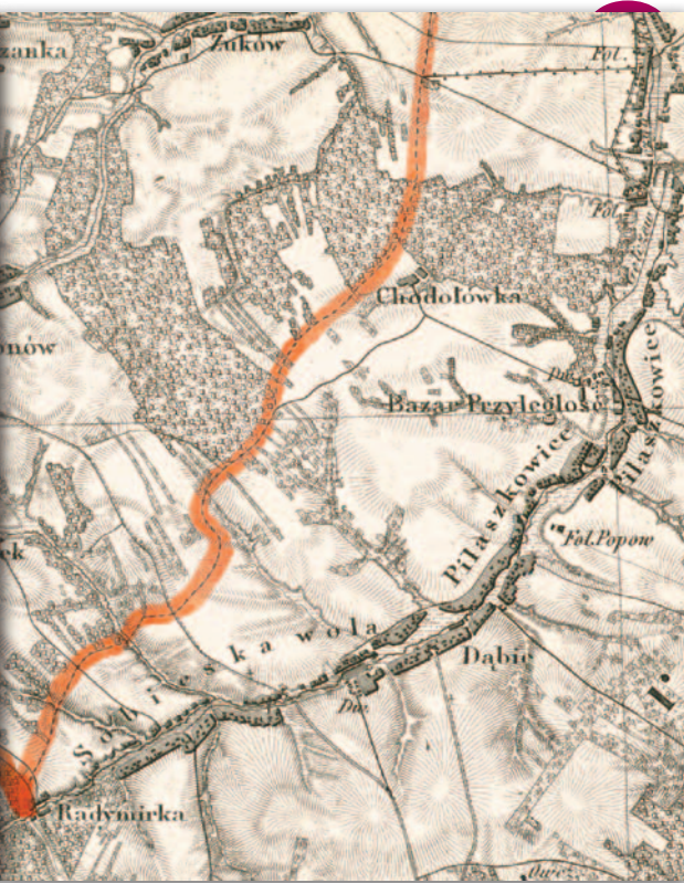
2. Arkusz mapy topograficznej Królestwa Polskiego z oznaczoną wsią Pilaszkowice z przysiółkiem Chodołowka, 1839-1843 r., Topograficzna Karta Królestwa Polskiego, AGAD, Zb. Kart. 75-1, kol. VI sek. X