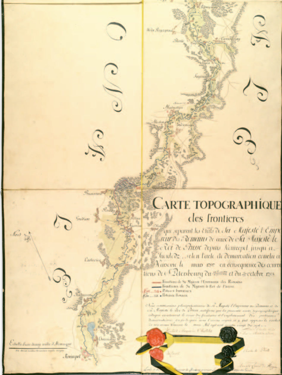
5. Mapa demarkacyjna granicy austriacko-pruskiej od Konecypola do Niemirowa, 17 marca 1797 r. (cztery pierwsze sekcje pierwszego arkusza), AGAD, KIO, 656, ark. 2, sekcje 1-4

bionych barwami państwowymi – orłem cesarskim i orłem pruskim. Podobnie jak na pruskich mapach wykreślono sieć hydrograficzną, komunikacyjną oraz szczególne sytuacyjne.