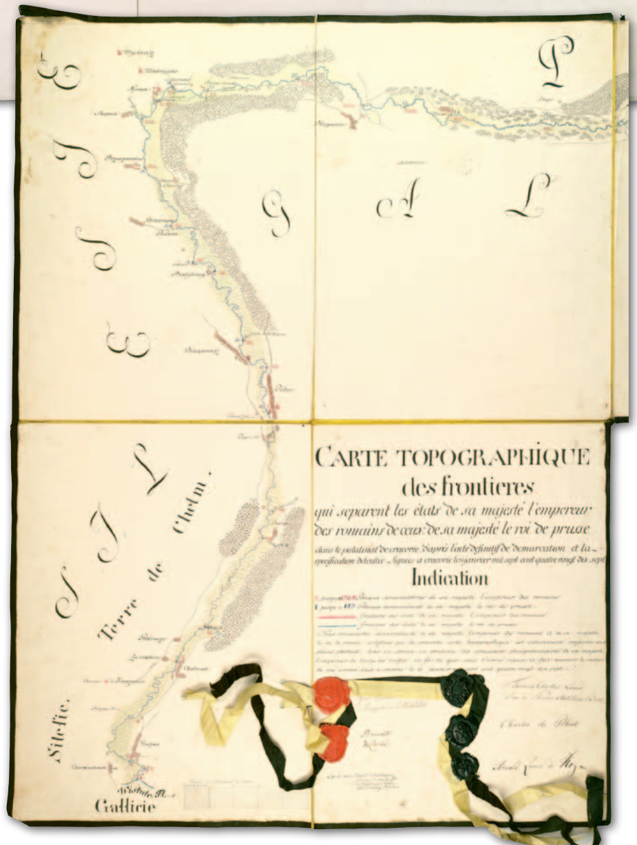
3. Mapa demarkacyjna granicy austriacko-pruskiej w województwie krakowskim, 31 stycznia 1797 r. (cztery pierwsze sekcje pierwszego arkusza), AGAD, KIO, 655, ark. 2, sekcje 1-4

M apa granicy austriacko-pruskiej w województwie krakowskim składa się z arkusza zbiorczego (ryc. 2) i 5 arkuszy, z których każdy podzielony jest na 4 sekcje. Arkusze obejmujące odcinki granicy zostały razem naklejone na jedwab w kolorze złotym i fizycznie stanowią całość – brzegi oklejono czarną jedwabną taśmą. Arkusz zbiorczy