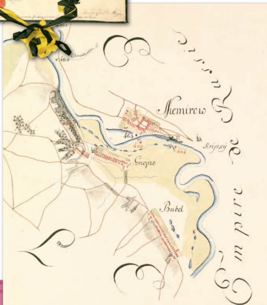
6. Mapa demarkacyjna granicy austriacko-pruskiej od Konecypola do Niemirowa, 17 marca 1797 r. (sekcja „Niemirow”), AGAD, KIO, 656, ark. 6, sekcja 15

ponad 141 tys. km 2 z ludnością liczącą 2,6 mln osób. Natomiast Austria, biorąc udział w pierwszym i trzecim rozbiórce, zaanektowała około 129 tys km 2 i ponad 4 mln mieszkańców.