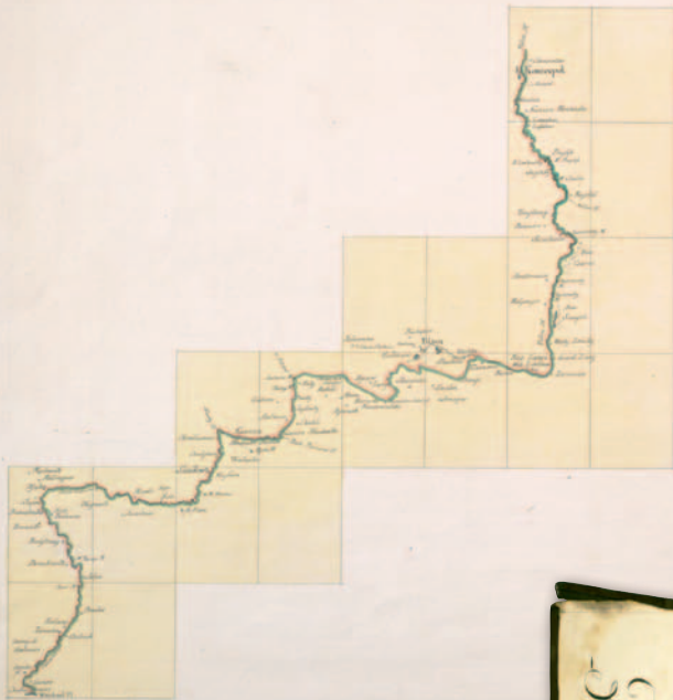
2. Mapa demarkacyjna granicy austriacko-pruskiej w województwie krakowskim, 31 stycznia 1797 r. (arkusz zbiorczy), AGAD, KIO, 655, ark. 1

finitywnej demarkacji, opis przebiegu linii granicznej i mapa granicy od ujścia Przemszy do Koniecpola opatrzone pieczęciami i podpisami komisarzy granicznych austriackich i pruskich oraz protokołów uwierzytelniający podpisany i opieczętowany przez mediatorów rosyjskich znajdują się w zasobie Oddziału Kartografii Archiwum Głównego Akt Dawnych w Warszawie. Są to oryginały dokumentów demarkacyjnych strony austriackiej, które do zbiorów polskich zostały przekazane na mocy umowy archiwalnej zawartej pomiędzy Austrią i Polską z 26 października 1932 r.