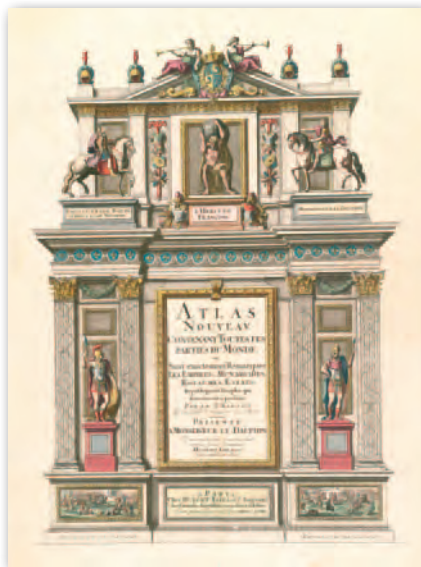
1. Strona dedykacyjna „Atlas nouveau”