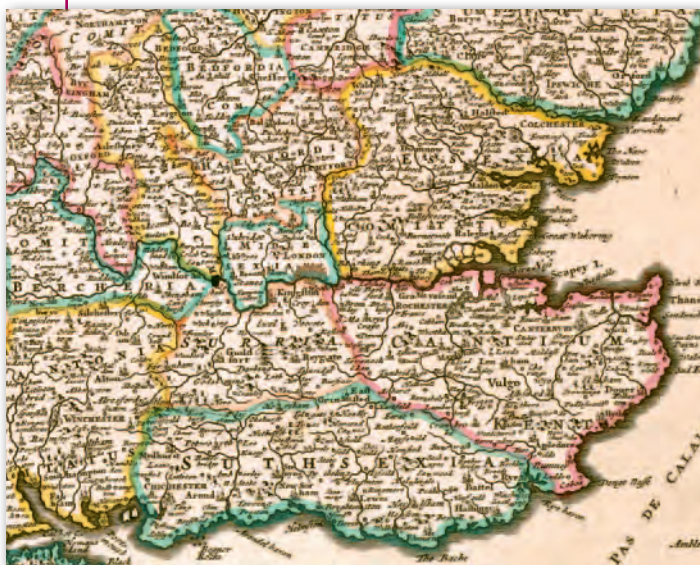
3. Mapa Anglii (fragm.), niedatowana, F. de Wit