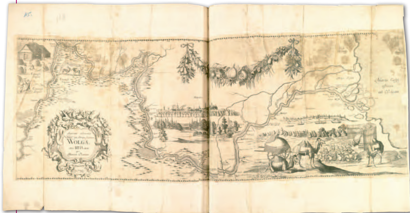
8. Mapa Wołgi, niedatowana, A. Olearius

znaczono także większe obszary leśne. Kolorowymi liniami wykreślono granice państwowe i granice województw. Ponadto na mapie umieszczono nazwy prowincji i województw.