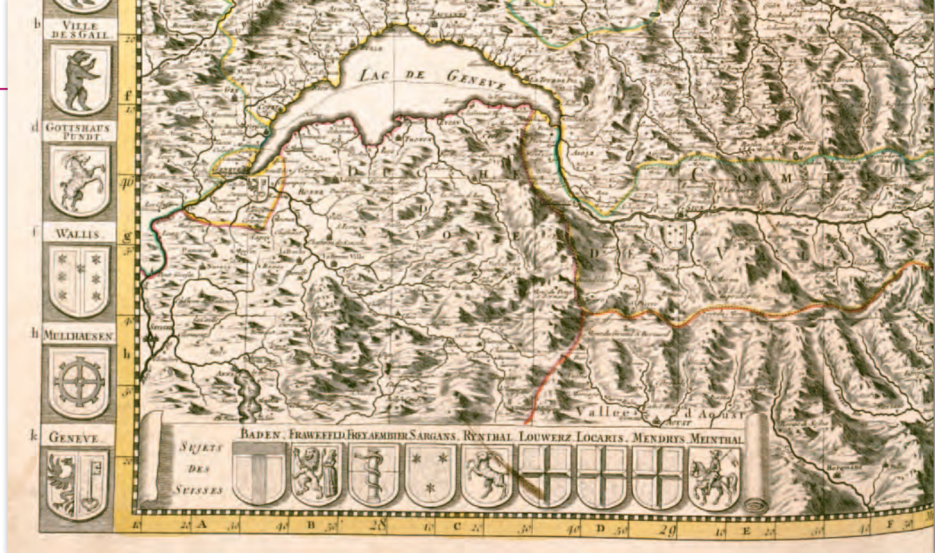
2. Mapa Szwajcarii (fragm.), 1693 r., G. Sanson, A.H. Jaillot