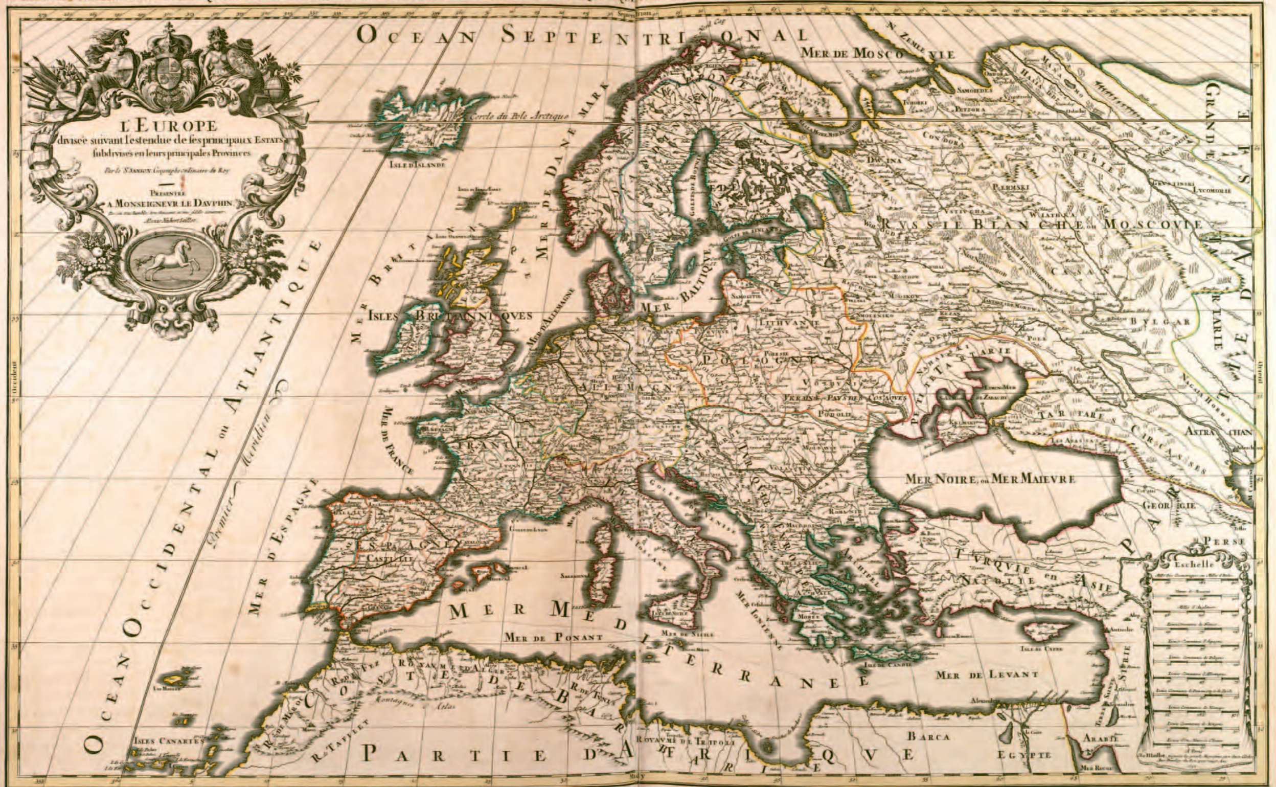
5. Mapa Europy, 1692 r., G. Sanson, A.H. Jaillot

L'EUROPE distinguée suivant l'estendue de ses principales Parties, savoir LES ISLES BRITANNIQUES, LA SCANDINAVIE, LA MOSCOVIE, LA FRANCE, L'ALLEMAGNE, LA Pologne, L'ESPAÑE, L'ITALIE, et LA TURQUIE en EUROPE ET DANS CES PARTIES SONT REMARQUÉS LES EMPIRES, MONARCHIES, ROYAUMES, ESTATS, et REPUBLIQUES, QUI PARTAGENT PRESENTEMENT L'EUROPE. Dressé sur les Mémoires les plus Nouveaux. Par le Sr. Sanson Geographe ord' du Roy