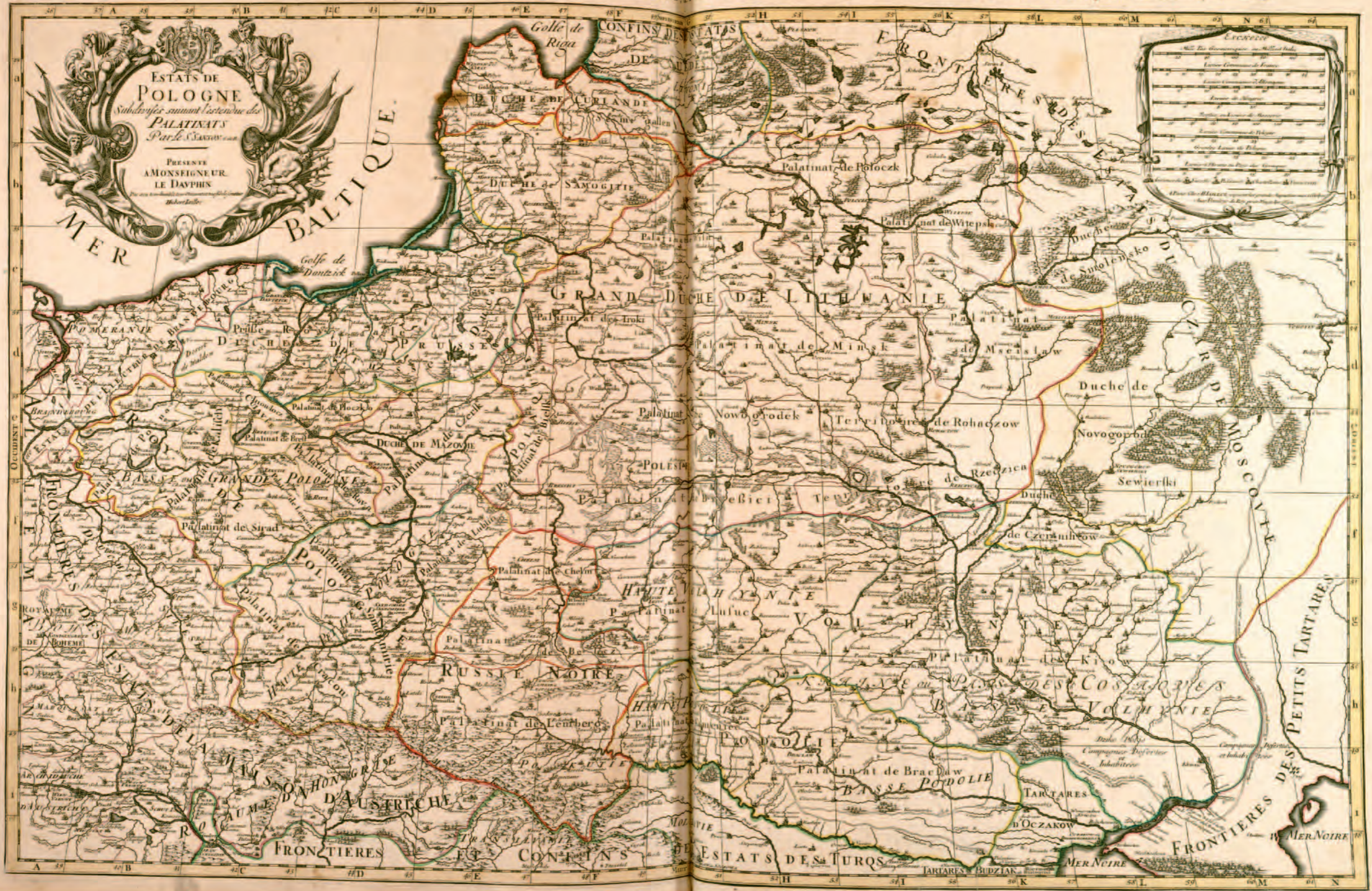
6. Mapa Rzeczypospolitej, 1692 r., G. Sanson, A.H. Jaillot