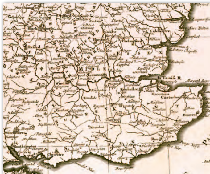
4. Mapa Anglii (fragm.), 1696 r., G. Sanson, A.H. Jaillot

podobnie jak inne wydania niderlandzkie – otwiera strona tytułowa i strona dedykacyjna dla delfina Francji (ryc. 1), obie opatrzone datą 1692 r. Trzecia ozdobna karta przeznaczona na spis treści atlasu „Table des cartes etc. Du Sr. Sanson. Conteneus Dans ce vollume” pozostała niewypełniona. Do atlasu dołączona jest luźna karta zawierająca spis treści i indeks map.